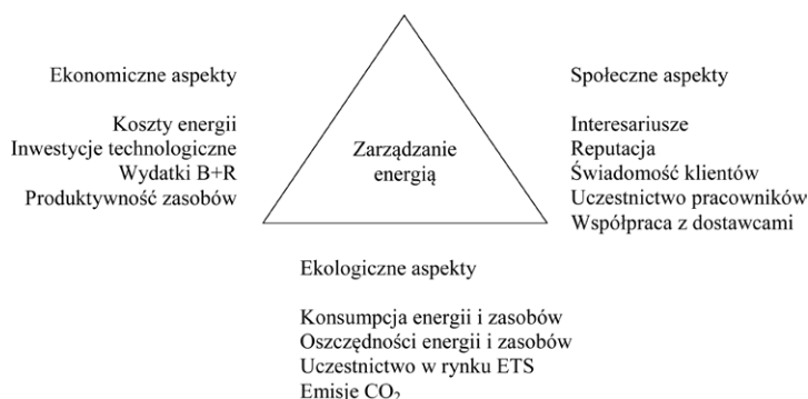
Rys. 1. Aspekty efektywności energetycznej w kontekście rozwoju zrównoważonego