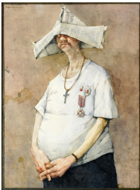
Ryc. 1. J. Duda-Gracz, Autoportret (Ora et kolabora) , 1982, olej na płycie pilśniowej, 80 x 60,5 cm

również portrety papieskie, portrety tamtejszych zakonników (także późniejszego zleceniodawcy Golgoty jasnogórskiej – o. Jana Golonki). W błędnej interpretacji obrazu, zanotowanej na kartach leksykonu, wysunięto na pierwszy plan kwestię zależności malarza od władzy i ustroju komunistycznego, odczytując mylnie wykorzystane w obrazie atrybuty (Chrzanowska-Pieńkos, Pięnkos red. 1996). Artystę ta interpretacja ubodła, o czym wspomniał w kalendarium swej twórczości (Duda-Gracz 2001). Autorami wywodu o obrazie nie byli uczniowie i amatorzy, lecz zawodowcy i historycy sztuki, których trudno podejrzewać o tendencyjność czy złą wolę. Sądzę, że zadecydowało błędne rozpoznanie – odznaczenia państwowe i czapka z Trybuny Robotniczej zostały odczytane jako argument odnoszący się do faktów, a nie jako argument odnoszący się do sfery emocji.