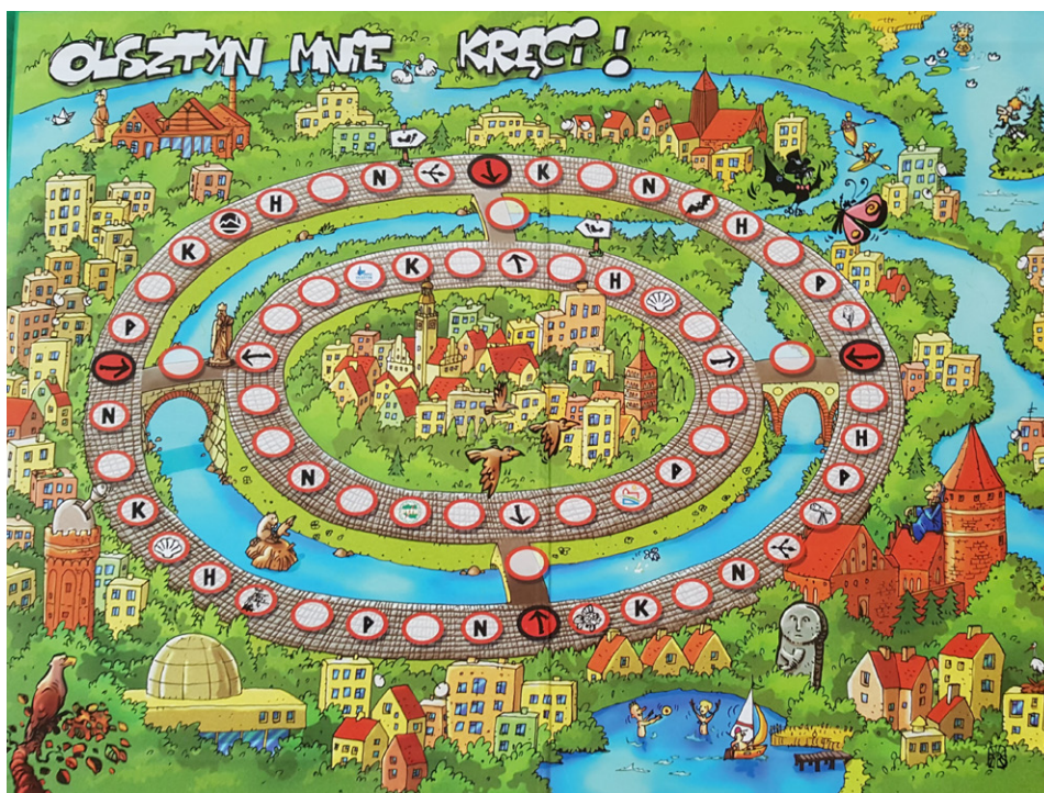
Fot. 2. Gra Olsztyn mnie kręci

została wydana w 100 egzemplarzach i była dystrybuowana głównie w olsztyńskich szkołach podstawowych i gimnazjalnych oraz w wybranych bibliotekach miejskich. Biuro Promocji i Turystyki Olsztyna prezentowało grę na krajowych targach turystycznych. Spotkała się także z dużym zainteresowaniem mieszkańców miasta, gdy uczyniono z niej nagrodę w konkursach organizowanych przez Miejską Informację Turystyczną.