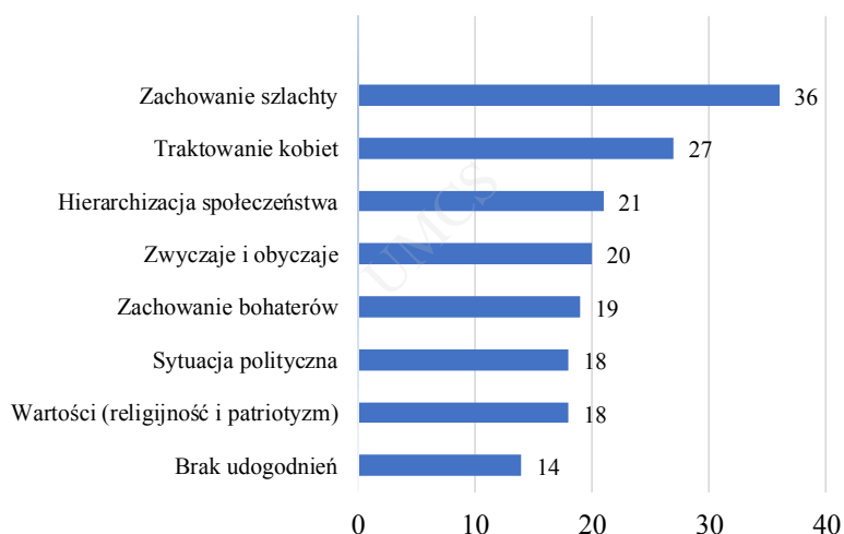
Rys. 4. Odpowiedzi na pytanie: Co w świecie Pana Tadeusza budziłoby Twój sprzeciw?

poddają go własnej hierarchii wartości, w której dużą rolę odgrywa poszerzona przestrzeń empatii, obejmująca kobiety czy też inne niż szlachta grupy społeczne. Uczniowie dalecy są również od idealizowania zbiorowości szlacheckiej. Sprzeciw większości respondentów (36) budzi jej porywcze i awanturnicze zachowanie, a cechujący ją kult tradycji łączą z niechęcią do jakichkolwiek zmian, ze stagnacją. Wskazują na hulaszczy tryb ich życia i skupianie się na śmiesznych, małostkowych sporach. Co ciekawe, w grupie odpowiedzi wyłoniło się też zdanie odmienne, podkreślające potrzebę odheroizowania tych bohaterów zbiorowej świadomości: „Podobało mi się ukazanie szlachty od tej drugiej strony, nie tylko jako dostojnych i męźnych, ale również kłótliwych i ze słabością do alkoholu”.