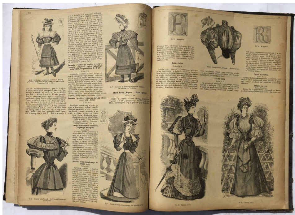
Ryc. 1. „Bluszcz. Pismo tygodniowe ilustrowane dla kobiet” 1894, nr 30 (dodatek)

wzbudza erotyczny pociąg nie tylko u swojego męża, ale i u innych mężczyzn. Co istotne, Franek, który jest świadomy wrażenia, jakie wywiera na otoczeniu jego żona, cieszy się z tego, a nieukrywaną satysfakcję sprawia mu wyobrażenie sobie spotkań na Czystym z mężczyznami, którzy zachwyconym spojrzeniem obdarzą Józkę, jemu zaś będą „znacząco mrugali”. W tej postawie mężczyzna, a zwłaszcza w ich spojrzeniach, Franek będzie odczytywał podziw i pożądanie dla żony, dla siebie zaś męskie uznanie. Józce w ogóle nie przeszkadza ani to, że będzie oglądana przez obcych mężczyzn, ani to, że na ten widok wystawia ją własny mąż oraz... ona sama. Bohaterka nie protestuje zarówno w mieszkaniu, gdzie jest oglądana przez męża (który równocześnie ocenia jej wygląd: „obchodził [ją] ze wszech stron, pociągał, poprawiał. Palcem poślinić już się nie ważył. Brał w zamian szcztokę i czyścił skrupulatnie”; Berent 1992c: 73), jak i podczas wycieczki, gdy co rusz natyka się na uważny męski wzrok. Erotyczna moc spojrzenia znana jest od starożytnej opowieści o Meduzie. Będąc potworem, a w zasadzie potworną emanacją kobiecej seksualności, niosła za sobą i obietnicę rozkoszy, i pożarcie przez śmierć. Toteż „wskutek pożądania, obejmującego