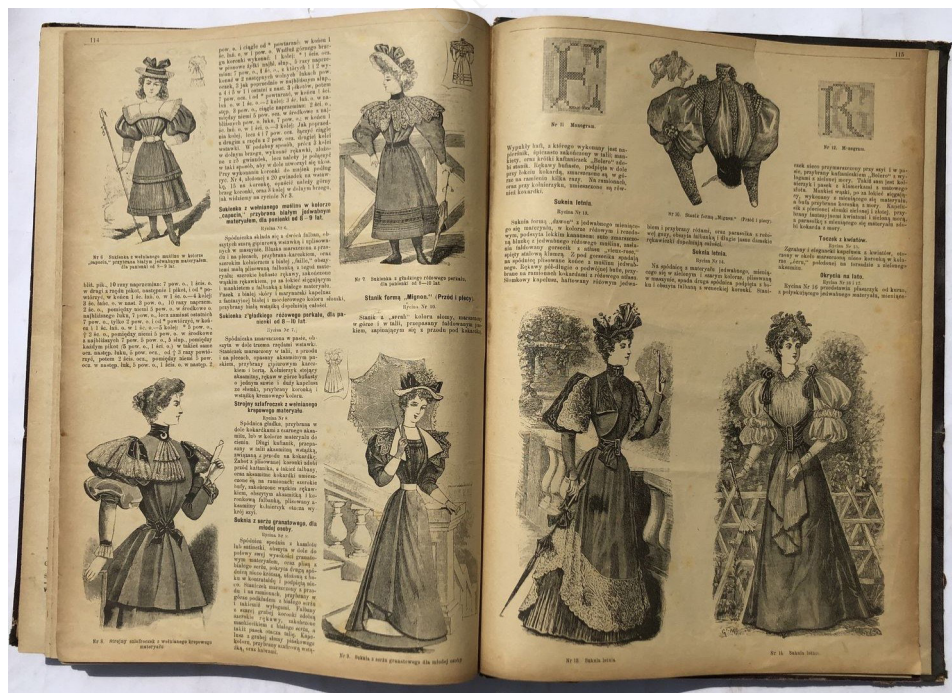
Ryc. 1. „Bluzeczka. Pismo tygodniowe ilustrowane dla kobiet” 1894, nr 30 (dodatek)

wzbudza erotyczny pociąg nie tylko u swojego męża, ale i u innych mężczyzn. Co istotne, Franek, który jest świadomy wrażenia, jakie wywiera na otoczeniu jego żona, cieszy się z tego, a nieukrywaną satysfakcję sprawia mu wyobrażanie sobie spotkań na Czystym z mężczyznami, którzy zachwyconym spojrzeniem obdarzą Józkę, jemu zaś będą „znaczące mrugali”. W tej postawie mężczyzna, a zwłaszcza w ich spojrzeniach, Franek będzie odczytywał podziw i pożądanie dla żony, dla siebie zaś męskie uznanie. Józce w ogóle nie przeszkadza ani to, że będzie oglądana przez obcych mężczyzn, ani to, że na ten widok wystawia ją własny mąż oraz... ona sama. Bohaterka nie protestuje zarówno w mieszkaniu, gdzie jest oglądana przez męża (który równocześnie ocenia jej wygląd: „obchodził [ją] ze wszech stron, pociągał, poprawiał. Palcem poślinić już się nie ważył. Brał w zamian szcztokę i czyścił skrupulatnie”; Berent 1992c: 73), jak i podczas wycieczki, gdy co rusz natyka się na uważny męski wzrok. Erotyczna moc spojrzenia znana jest od starożytnej opowieści o Meduzie. Będąc potworem, a w zasadzie potworną emanacją kobiecej seksualności, niosła za sobą i obietnicę rozkoszy, i pożarcie przez śmierć. Toteż „wskutek pożądania, obejmującego