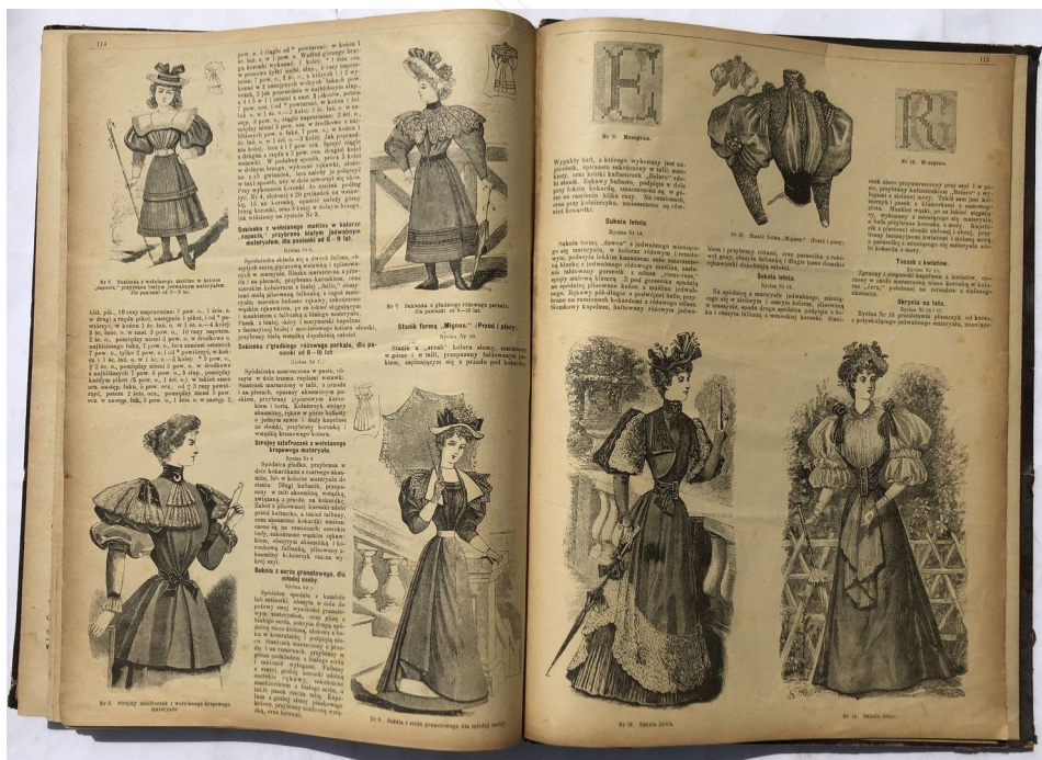
Ryc. 1. „Bluzeczka. Pismo tygodniowe ilustrowane dla kobiet” 1894, nr 30 (dodatek)

wzbudza erotyczny pociąg nie tylko u swojego męża, ale i u innych mężczyzn. Co istotne, Franek, który jest świadomy wrażenia, jakie wywiera na otoczeniu jego żona, cieszy się z tego, a nieukrywaną satysfakcję sprawia mu wyobrażanie sobie spotkań na Czystym z mężczyznami, którzy zachwyconym spojrzeniem obdarzą Józkę, jemu zaś będą „znacząco mrugali”. W tej postawie mężczyzna, a zwłaszcza w ich spojrzeniach, Franek będzie odczytywał podziw i pożądanie dla żony, dla siebie zaś męskie uznanie. Józce w ogóle nie przeszkadza ani to, że będzie oglądana przez obcych mężczyzn, ani to, że na ten widok wystawia ją własny mąż oraz... ona sama. Bohaterka nie protestuje zarówno w mieszkaniu, gdzie jest oglądana przez męża (który równocześnie ocenia jej wygląd: „obchodził [ją] ze wszech stron, pociągał, poprawiał. Palcem poślinić już się nie ważył. Brał w zamian szcztokę i czyścił skrupulatnie”; Berent 1992c: 73), jak i podczas wycieczki, gdy co rusz natyka się na uważny męski wzrok. Erotyczna moc spojrzenia znana jest od starożytnej opowieści o Meduzie. Będąc potworem, a w zasadzie potworną emanacją kobiecej seksualności, niosła za sobą i obietnicę rozkoszy, i pożarcie przez śmierć. Toteż „wskutek pożądania, obejmującego