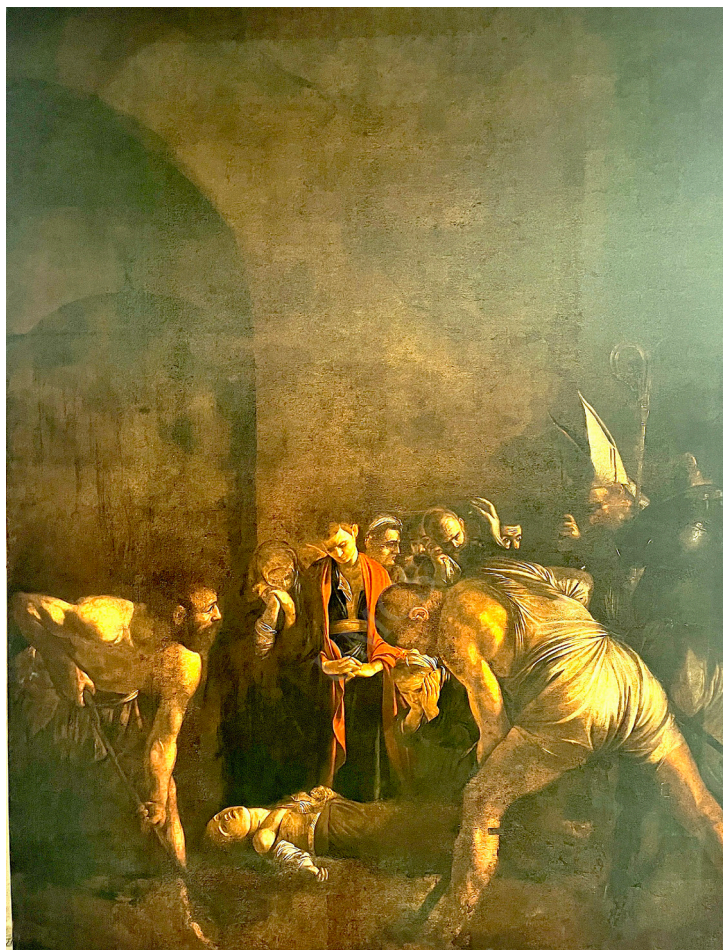
Ryc. 2. Caravaggio, Pogrzeb św. Łucji , Santuario di Santa Lucia al Sepolcro, Syrakuzy

Obraz ołtarzowy miał zostać wykonany do odnawianego w tym czasie, znajdującego się poza granicami miasta, kościoła św. Łucji 7 .