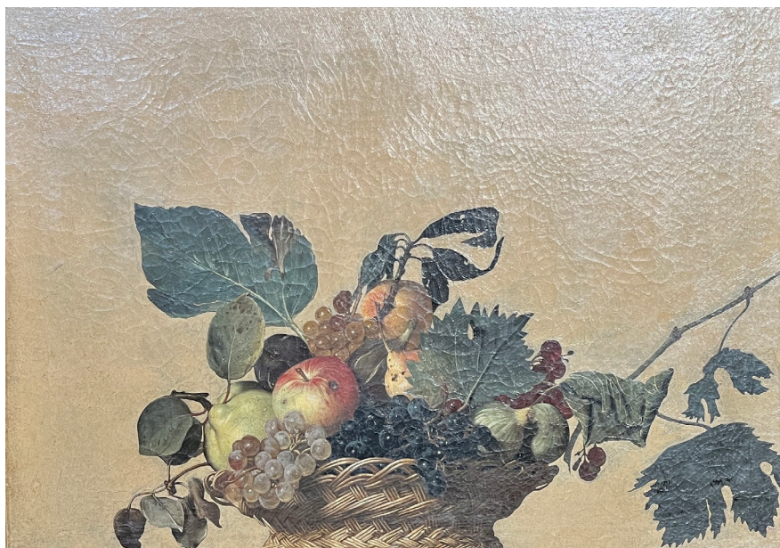
Ryc. 1. Caravaggio, Kosz z owocami, Ambrosiana, Mediolan