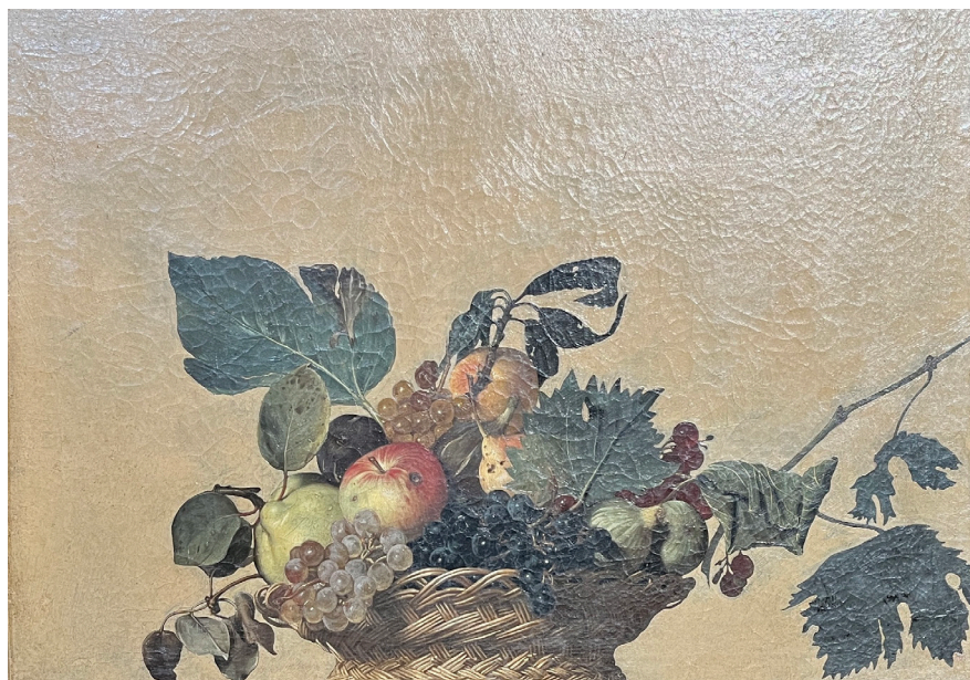
Ryc. 1. Caravaggio, Kosz z owocami, Ambrosiana, Mediolan