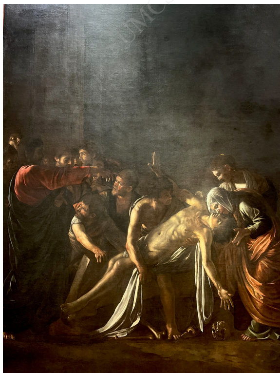
Ryc. 4. Caravaggio, Wskrzeszenie Łazarza , muzeum regionalne w Mesynie

Niedługo po namalowaniu Pogrzebu św. Lucji – być może autor nie doczekał nawet do momentu jego oficjalnego umieszczenia w ołtarzu, planowanego najprawdopodobniej na dzień św. Lucji (który na początku XVII wieku obchodzono nie 13 grudnia, lecz w czasie zimowego przesilenia, w najkrótszy dzień roku) – Caravaggio opuścił Syrakuzy i udał się do Mesyny. Zdobył tam zamówienie na ołtarzowy obraz przedstawiający wskrzeszenie Łazarza do kaplicy kościoła ojców Crociferi, opiekujących się chorymi (Langdon 2003: 388). Współcześnie znane Wskrzeszenie Łazarza może nie być pierwszą wersją obrazu, która prawdopodobnie została zniszczona przez samego autora pod wpływem emocji wywołanych uwagami pierwszych odbiorców na temat dzieła. Jest jednak z pewnością dziełem Caravaggia i nawiązuje do historii znanej z Ewangelii św. Jana.