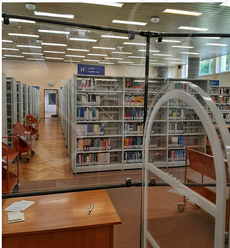
Fot. 2. Czytelnia 1 Wolnego Dostępu na parterze budynku Biblioteki UMCS.