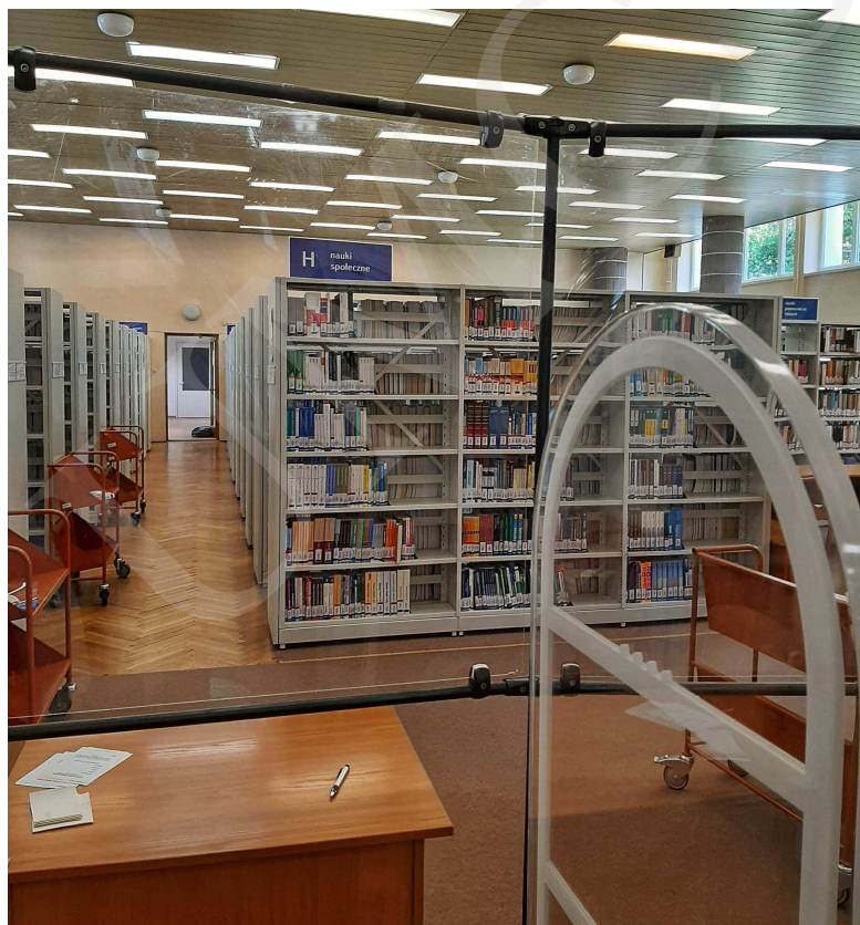
Fot. 2. Czytelnia 1 Wolnego Dostępu na parterze budynku Biblioteki UMCS.