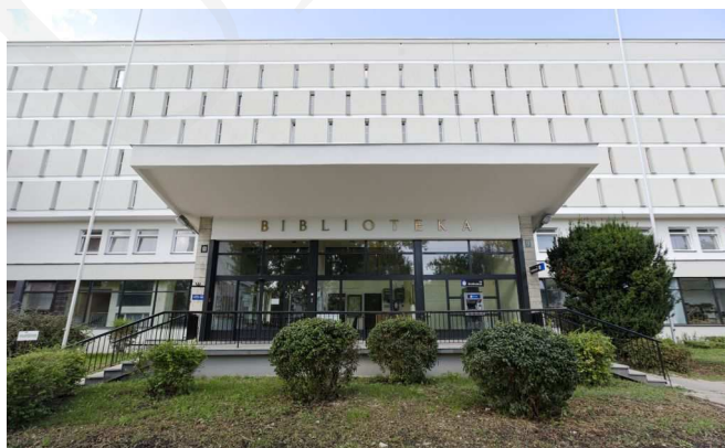
Fot. 1. Budynek Biblioteki Głównej UMCS.

Główną siedzibą Biblioteki od roku 1968 jest gmach przy w ul. Radziszewskiego 11, usytuowany w samym centrum kampusu, w bliskim sąsiedztwie budynków