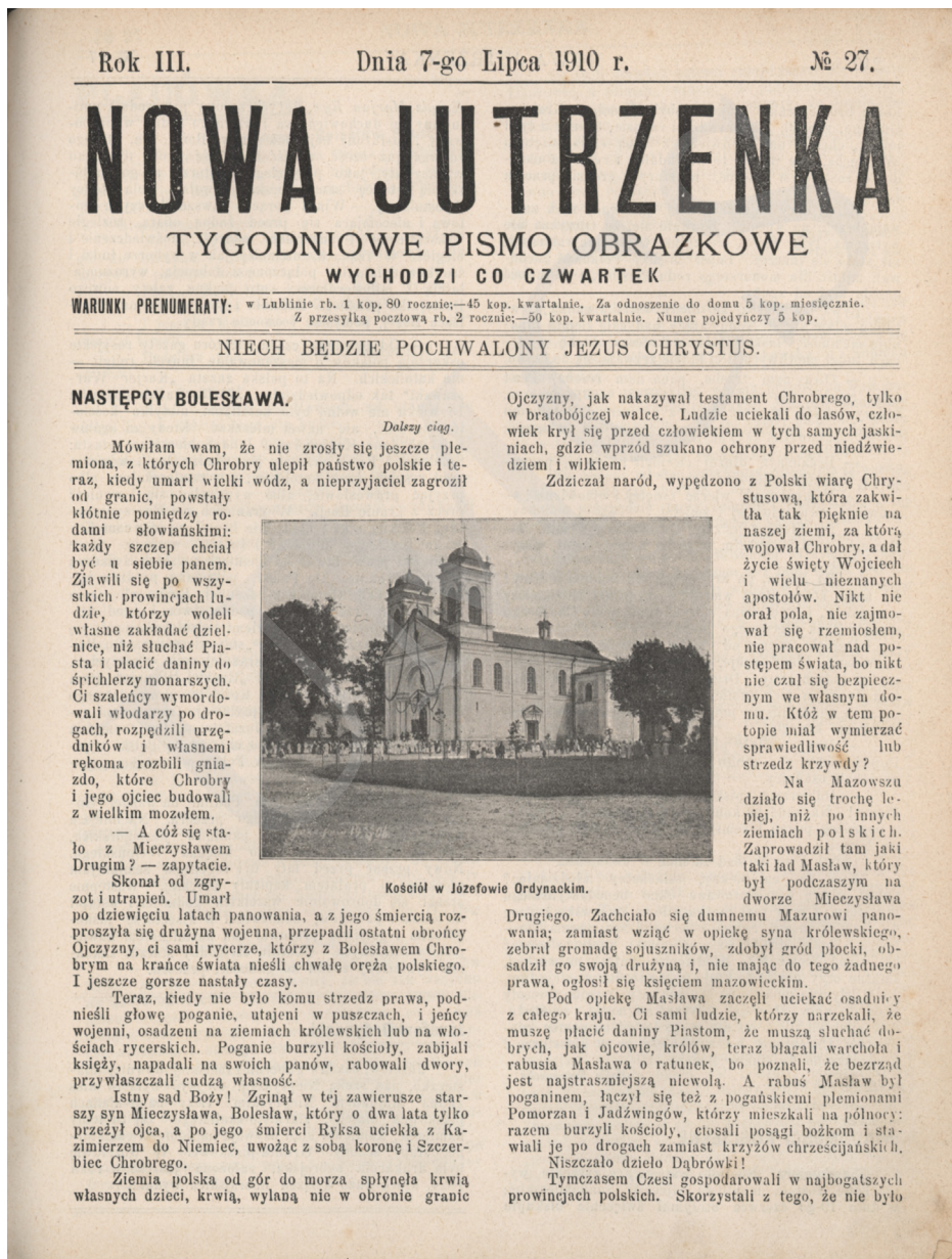
Rycina 1.

Jak wspomniano, tygodnik zawierał 8–12 stron. Pierwsze strony były poświęcone zwykle nauczaniu moralnemu w duchu nauki społecznej Kościoła katolickiego, autorstwa głównie księdza redaktora, ale również mogły być tu teksty historyczne, ob-