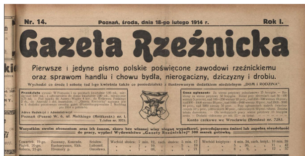
Ryc. 3.

Następny element winyety to informacje o częstotliwości. W pierwszym roczniku jest nieregularna – dwa razy w tygodniu: co środę i sobotę od numeru 1. do 19., trzy razy w tygodniu: co poniedziałek, środę i sobotę od numeru 20. do 76., ponownie dwa razy: co poniedziałek i czwartek w numerach 77. i 78. oraz co środę i sobotę od numeru 79. do 111. Numery od 104. do 107. pomimo oznaczenia: co środę i sobotę wydawane były 1 raz w tygodniu, w soboty. W tej części występuje informacja o dodatku niedzielnym „Dom i rodzina” w numerach: od numeru 2. (7 stycznia 1914) do numeru 69. (18 lipca 1914). Od numeru 72. brakuje dodatku niedzielnego. W 1918 r. gazeta była wydawana regularnie jako tygodnik co sobotę. Niżej zamieszczono dwie ramki z informacjami, po lewej stronie warunki przedpłat, adres redakcji i administracji, po prawej ceny ogłoszeń, rabaty stosowane przy ogłoszeniach większych i stałych oraz numer konta czekowego we Wrocławiu i Wiedniu. Pomiędzy ramkami znajduje się rysunek podobny do tego, który widnieje na pieczęci Cechu Rzeźników w Poznaniu: głowa byka na tle dwóch skrzyżowanych toporów, otoczony ramką. Pod nimi dwa ostatnie elementy występujące w pierwszym roczniku: informacja o ubezpieczeniu abonentów i ich rodzin oraz oddzielony kreską kalendarzyk z informacjami o imieninach, wschodach i zachodach słońca oraz księżycy na najbliższe dni, do następnego wydania.