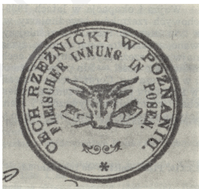
Ryc. 1. Pieczęć Cechu Rzeźników w Poznaniu z 1911 r.

Rzeźnictwo, podobnie jak inne rzemiosła w Polsce, miało strukturę cechową. Dla każdej branży powstawał osobny cech. W dużych miastach było nawet kilkadziesiąt różnych cechów, istniały nieliczne cechy wielobranżowe. Pierwsza wzmianka o cechach rzeźnickich pochodzi z 1235 roku w Środzie Śląskiej. W Poznaniu początkowo istniały dwa cechy rzeźnicze, dwóch grup jatek: starszych murowanych i późniejszych drewnianych o nieustalonej dacie powstania. Pierwszy katalog cechów Poznania z 1440 r. wymienia już dwa cechy. Zjednoczenie obu nastąpiło w 1729 r., powstało „Bractwo Rzeźnicze Poznańskie Jatek Murowanych”, od 1796 r. znane jako „Bractwo Rzeźnicze Poznańskie”. Cech poznański w połowie XIX w. był największym cechem w Polsce liczącym od 272 do 305 członków. Przez cały okres utraty niepodległości w dokumentach cechowych posługiwano się językiem polskim, dopiero od 1880 r. protokoły sprawozdawcze były dwujęzyczne: polskie i niemieckie. Podobnie pieczęć cechu miała napis w dwóch językach. Symbolem organizacyjnej jedności cechu była skrzynia cechowa, w której przechowywano ważniejsze dokumenty oraz pieczęć, łańcuch, buzdygan (berło) i sztandar 14 .