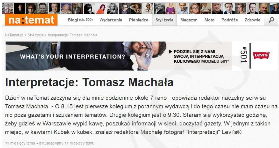
Ryc. 1. Interpretacje: Tomasz Machała