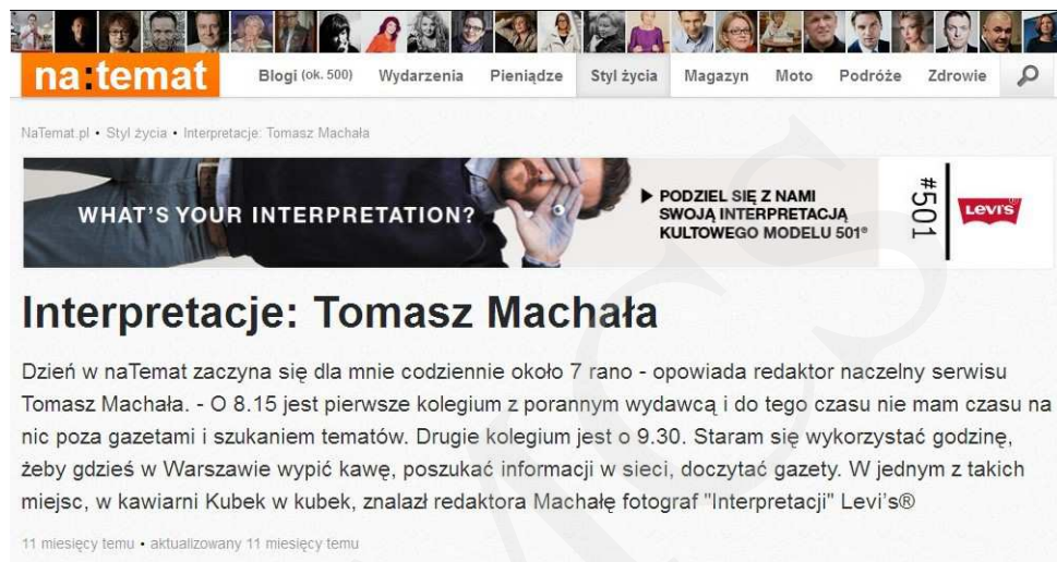
Ryc. 1. Interpretacje: Tomasz Machała

Źródło: Interpretacje: Tomasz Machała [online]. Dostępny w World Wide Web: http://interpretacje.natemat.pl/57547,interpretacje-tomasz-machała [data dostępu: 12.03.2014].