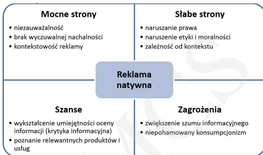
Ryc. 7. Schemat cech reklamy natywnej w optyce analizy SWOT