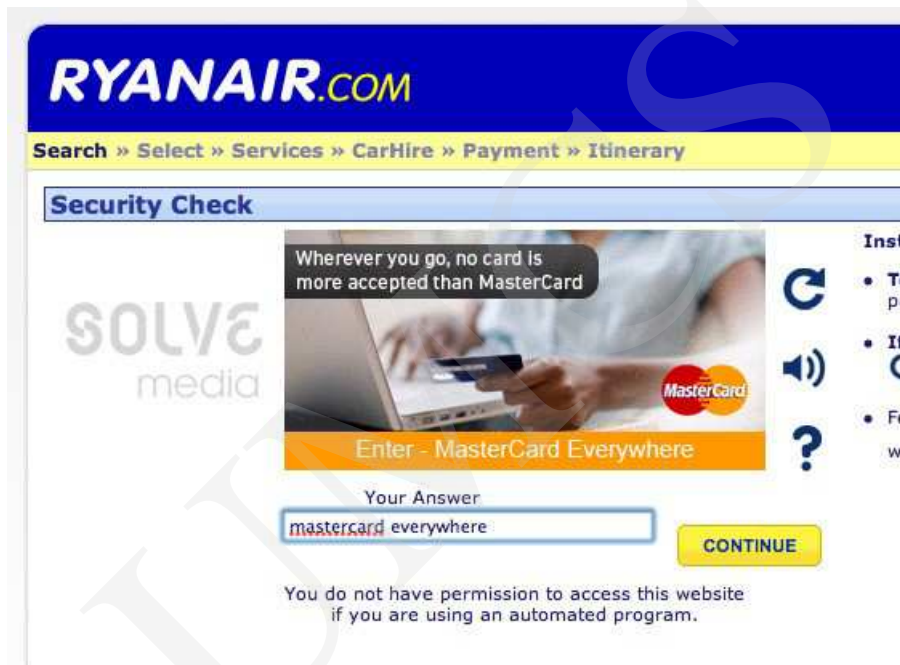
Ryc. 5. Ryanair – CAPTCHA

użytkownik i tak musi zapoznać się z reklamą, by przepisać tekst. Zapoznanie się z treścią reklamy jest zatem w tym przypadku nieuniknione 11 .