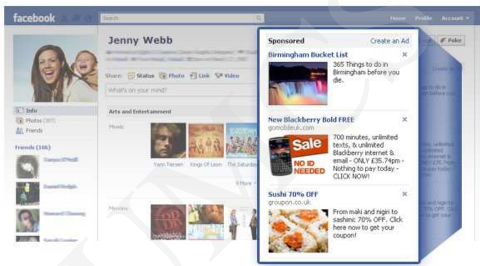
Ryc. 4. Facebook – reklama

lubi bądź obserwuje. Użytkownik ma przeświadczenie, że pokazuje znajomym, co lubi, a tak naprawdę dopuszcza do siebie kolejnych reklamodawców. Co gorsza, przeglądając strumień danych na Facebooku, użytkownik nie zauważa, że wśród informacji z profili znajomych znajdują się także ukryte reklamy 10 .