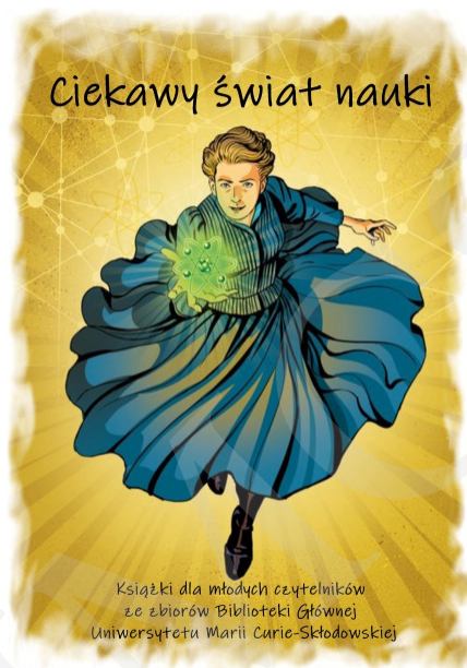
Fot. 1. Plakat reklamujący wystawę, autorstwa I. Mielniczuk i M. Zawady, zamieszczony na witrynie internetowej BG UMCS oraz ustawiony na wejściu przed wystawą.

Książki zaprezentowano na stołach i mobilnych ekspozytorach w kilku blokach tematycznych, np. astronomia, medycyna, historia itp. Przy każdym przygotowano tablice z ciekawymi informacjami oraz postaciami ze świata nauki. Uzupełnieniem prezentowanych pozycji książkowych był stary sprzęt techniczny w postaci dwóch telefonów tarczowych oraz maszyn do pisania. Dla odwiedzających przygotowano strefę relaksu, w której można było odpocząć i poczytać. Obok znajdował się kącik plastyczny, w którym najmłodszy odwiedzający mieli możliwość uwiecznienia wrażeń z wystawy. Pozostawione przez nich dzieła były prezentowane na specjalnej tablicy umieszczonej obok wystawy.