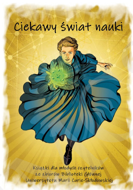
Fot. 1. Plakat reklamujący wystawę, autorstwa I. Mielniczuk i M. Zawady, zamieszczony na witrynie internetowej BG UMCS oraz ustawiony na wejściu przed wystawą.

Książki zaprezentowano na stołach i mobilnych ekspozytorach w kilku blokach tematycznych, np. astronomia, medycyna, historia itp. Przy każdym przygotowano tablice z ciekawymi informacjami oraz postaciami ze świata nauki. Uzupełnieniem prezentowanych pozycji książkowych był stary sprzęt techniczny w postaci dwóch telefonów tarczowych oraz maszyn do pisania. Dla odwiedzających przygotowano strefę relaksu, w której można było odpocząć i poczytać. Obok znajdował się kącik plastyczny, w którym najmłodszy odwiedzający mieli możliwość uwiecznienia wrażeń z wystawy. Pozostawione przez nich dzieła były prezentowane na specjalnej tablicy umieszczonej obok wystawy.