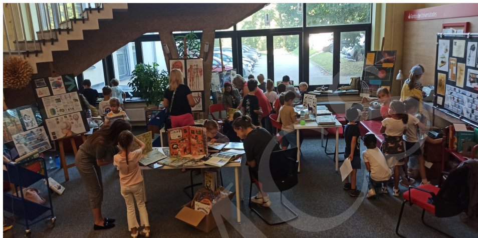
Fot. 2. Wystawa, fot. I. Mielniczuk.

Podczas 5 dni XIX Lubelskiego Festiwalu Nauki wystawę odwiedziło 20 zorganizowanych grup uczniów reprezentowanych przez klasy 0–8 szkół podstawowych z Lublina i okolic, przedszkolaki oraz osoby prywatne zainteresowane literaturą dziecięcą. W sumie wystawę odwiedziło 431 osób.