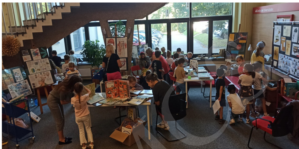
Fot. 2. Wystawa, fot. I. Mielniczuk.

Podczas 5 dni XIX Lubelskiego Festiwalu Nauki wystawę odwiedziło 20 zorganizowanych grup uczniów reprezentowanych przez klasy 0–8 szkół podstawowych z Lublina i okolic, przedszkolaki oraz osoby prywatne zainteresowane literaturą dziecięcą. W sumie wystawę odwiedziło 431 osób.