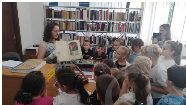
Fot. 7. Warsztaty „Iluminowany inicjał” – wprowadzenie teoretyczne