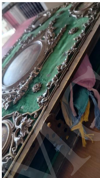
Fot. 4. Biblia w kunsztownie wykonanej oprawie, fot. A. Mikulska.

Duże wrażenie wywarła prezentacja najstarszych zasobów bibliotecznych, sięgających początków rozwoju druku, jak Biblia w przekładzie Marcina Lutera z 1686 roku o objętości około 4 tysięcy stron i wadze kilku kilogramów. Imponujące księgi oprawne w okładki wykonane z desek pokrytych tłoczoną skórą czy aksamitnym sukniem i opatrzonych dekoracyjnymi okuciami zaintrygowały odwiedzających, zapraszając do refleksji nad wartością oraz rozwojem książki w aspekcie historycznym i kulturalnym.