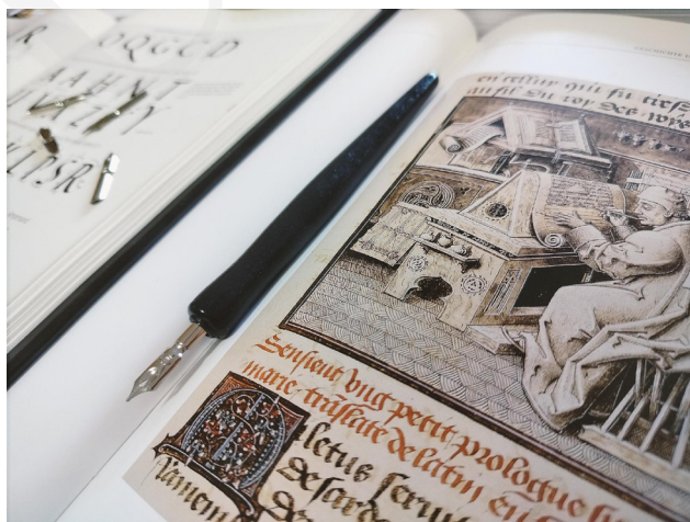
Fot. 1. Przykłady iluminacji i tradycyjnych materiałów piśmienniczych, fot. A. Mikulska.

W dniach 18–24 września 2023 roku Uniwersytet Marii Curie-Skłodowskiej w Lublinie aktywnie włączył się w organizację Lubelskiego Festiwalu Nauki. Dziewiętnasta edycja wydarzenia osiągnęła rekordowe wyniki pod względem zgłoszonych projektów – aż 1758 wydarzeń, prezentacji i warsztatów. Zgromadziła