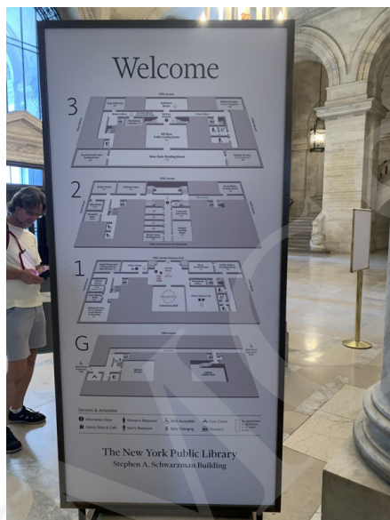
Fot. 2. Plan zwiedzania Biblioteki, fot. A. Strumińska.