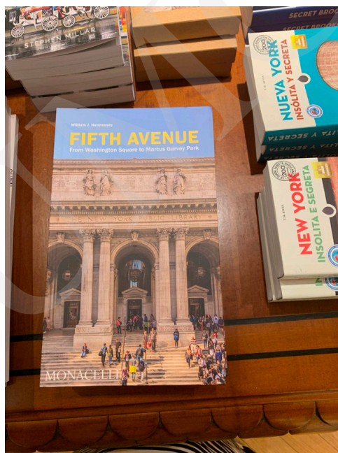
Fot. 8. Oferta sklepu w Bibliotece, fot. A. Strumińska.

Biblioteka posiada również swój sklep. Można tam kupić książki, kalendarze, a także różne gadżety pamiątkowe.