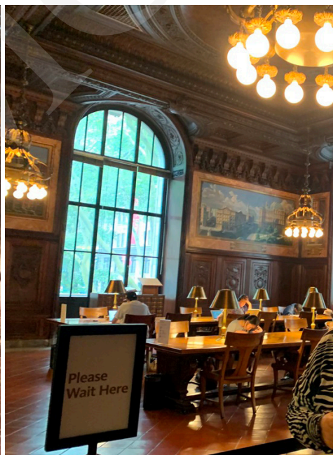
Fot. 5. Czytelnia Biblioteki

Biblioteka ma również ofertę dla najmłodszych. W podziemiach budynku znajduje się czytelnia dla dzieci. Wejścia do niej chroni lew wykonany z klocków lego. Najważniejszym eksponatem tej części biblioteki są pluszaki. Od 1987 roku w Nowojorskiej Bibliotece mieszka Kubuś Puchatek i jego przyjaciele: Prosiaczek, Kłapouchy, Kangurek i Tygrysek. Jak się dowiedziałam, to oryginalne maskotki małego chłopca Christopa Robina Milne, które stały się inspiracją dla jego Taty – Alana A. Milne do napisania najsłynniejszej i najpiękniejszej na świecie książki dla dzieci.