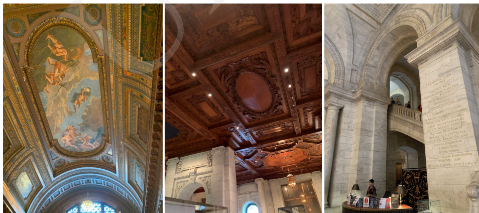
Fot. 3. Wnętrze Biblioteki, fot. A. Strumińska.

Zbiory Nowojorskiej Biblioteki rosną w zawrotnym tempie i obecnie część magazynów znajduje się poza budynkiem biblioteki, ale w jej bezpośrednim sąsiedztwie – pod pobliskim Bryant Parkiem, który zachwyca alejami londyńskich platanów 2 .