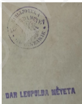
Ryc. 9. Pieczęćki Leopolda Méyeta.

Na swojej stronie internetowej Muzeum poszukuje wszelkich informacji i pamiątek związanych z rodziną Oborskich, w tym także książek, które znajdowały się w bibliotece rodziny 33 (można je rozpoznać po pieczętce). Obecnie w zbiorach mieleckiego Muzeum znajduje się jedynie kilkanaście książek pochodzących z rodowej biblioteki Oborskich.