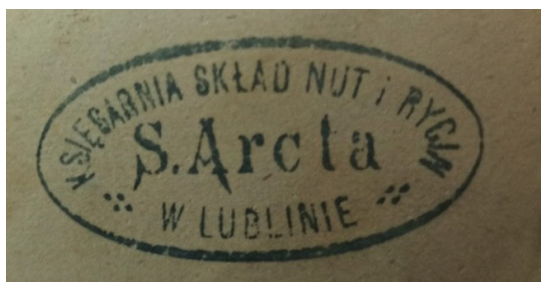
Ryc. 6. Pieczęćka firmy wydawniczo-księgarskiej Stanisława Arcta.

Waław Bajkowski był wybitnym polskim prawnikiem i społecznikiem, który pełnił funkcję prezydenta Lublina w latach 1916–1918 20 . Urodził się 31 grudnia 1875 r. we wsi Włostowice koło Puław. Po studiach prawniczych na Uniwersytecie Warszawskim w 1903 r. rozpoczął aplikację adwokacką w Lublinie, specjalizując się w prawie cywilnym. Oprócz pracy zawodowej angażował się również w działalność publiczną i samorządową, był jednym z organizatorów sądownictwa obywatelskiego w Lublinie. Na jego wniosek Rada Miejska z okazji 600-lecia nadania Lublinowi praw miejskich uchwaliła, by placowi przed Magistratem nadać imię króla Władysława Łokietka oraz zażądać zwrotu wywiezionych do Wilna najstarszych zasobów archiwalnych ziemi lubelskiej i Podlasia. W 1940 r. został zatrzymany przez Gestapo, wywieziony do obozów koncentracyjnych Sachsenhausen i Dachau, gdzie 11 kwietnia 1941 r. zginął. W uznaniu zasług Waława Bajkowskiego w 2009 r. ulica przy gmachu Ratusza (wcześniej ul. Przystankowa) została nazwana jego imieniem.