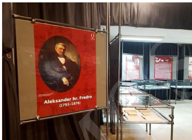
Fot. 6. Wystawa Aleksander hr. Fredro – polski Molière. W 230. rocznicę urodzin.