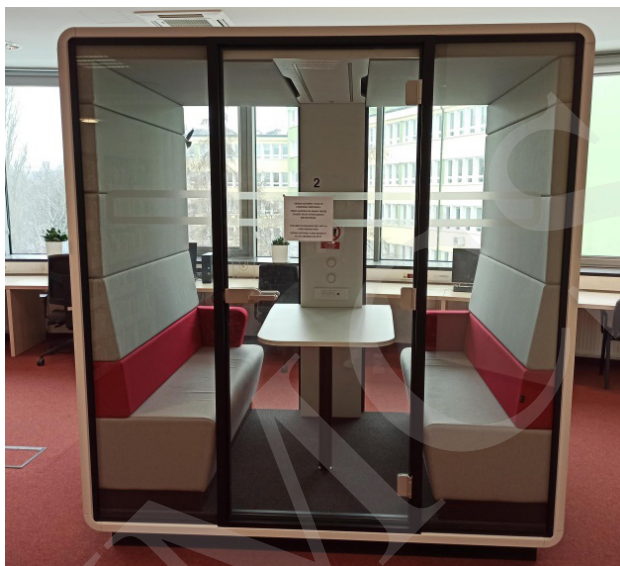
Fot. 2. Kabina multimedialna – Biblioteka Uniwersytetu Przyrodniczego Lublin.

Biblioteki w XXI w. na nowo definiują swoje funkcje w odpowiedzi na zmieniające się potrzeby użytkowników i rozwój techniki. Jej rola nie ogranicza się już tylko do zbierania i udostępniania książek, lecz obejmuje także bycie centrum innowacji, edukacji i integracji społecznej. Biblioteki stały się instytucjami świadczącymi usługi na rzecz swoich czytelników 18 , których potrzeby sprawiają, że biblioteka staje się miejscem pełnym kulturalnym wydarzeń. Dziś biblioteka to także czytelnicy, spotkania oraz integracja. Zainteresowaniem czytelników cieszą się festiwale książek, spotkania miłośników komiksów, spotkania z autorami, miłośników literatury, wykłady czy warsztaty. W Bibliotece Głównej UMCS w Lublinie organizowane są różne wydarzenia kulturalne, tj.: spotkania z mangą i anime dla miłośników komiksów, spotkania miłośników literatury, wykłady Stowarzyszenia Miłośników Dawnej Broni i Barwy, wieczorki poetyckie, warsztaty dla dzieci.