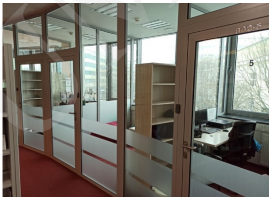
Fot. 1. Pokoje do pracy indywidualnej i grupowej – Biblioteka Uniwersytetu Przyrodniczego Lublin.

sale multimedialne, sale konferencyjne, laboratoria, centra dydaktyczne, kawiarnie czy miejsca relaksu. „Architektura biblioteczna [...], coraz częściej odchodzi od sztywnych podziałów na czytelnie, wypożyczalnię, ale stara się zapewnić przyjazne miejsce do pracy, nauki, odpoczynku, kontaktów społecznych” 13 . Budynki biblioteczne w swoich murach oferują ciekawe miejsca, w których warto przebywać 14 , gdzie można przyjść i miło spędzić czas. Osoba przychodząca do biblioteki nie musi być jej czytelnikiem i korzystać ze zbiorów, może wykorzystać specjalne przestrzenie do relaksu, spotkać się, porozmawiać ze znajomymi, napić się kawy. Użytkownikom biblioteka powinna kojarzyć się z miejscem przyjaznym, dającym poczucie bezpieczeństwa, zachęcającym do spotkań 15 . Współczesne biblioteki są wielofunkcyjne, oferują swoim czytelnikom miejsca nauki, edukacji, kultury, spotkań czy innych form działania 16 . Znajdują się tam strefy nauki, relaksu czy odpoczynku, gdzie można usiąść na pufie czy hamaku i cieszyć się książką. Dla najmłodszych są miejsca zabaw z kryjówkami do chowania się. Jeżeli potrzebujesz miejsca do spotkania ze znajomymi, do tego również jest biblioteka 17 .