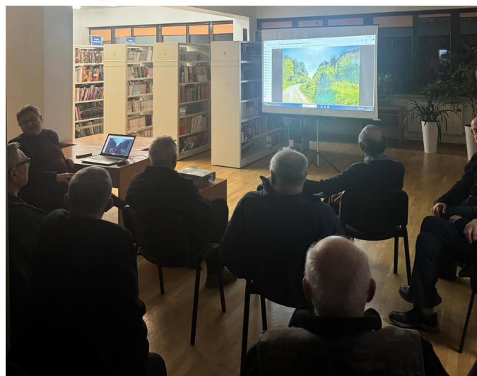
Fot. 5. Wykład Stowarzyszenia Miłośników Dawnej Broni i Barwy.