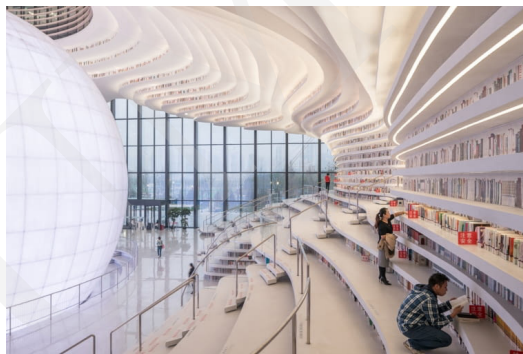
Fot. 11. Biblioteka Binhai w Tianjin, fot. Ossip van Duivenbode. Źródło: https://www.bryla.pl/bryla/7,85298,22639247,futurystyczna-biblioteka-w-chinach-od-mvrdrv.html .

Przykłady te pokazują, jak bardzo innowacyjne potrafią być budynki biblioteczne łączące funkcjonalną architekturę, estetykę i zaawansowaną technologię. Widoczne jest tworzenie miejsc przyjaznych czytelnikowi, sprzyjających nauce i integracji społecznej. Biblioteki tym samym odpowiadają na zmieniające się potrzeby społeczeństwa i rozwój technologiczny.