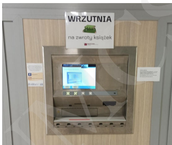
Fot. 12. Wrzutnia Biblioteki Uniwersytetu Przyrodniczego w Lublinie.

większej ilości informacji niż przy tradycyjnych kodach. Etykiety RFID umożliwiają odczytanie danych bez konieczności ściągnięcia książki z regału, lokalizują źle odłożone egzemplarze oraz zabezpieczają przed kradzieżą. System automatycznej identyfikacji RFID zapewnia szybsze i wydajniejsze zarządzanie zbiorami bibliotecznymi.