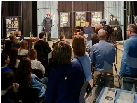
Fot. 3. Wernisaż wystawy „Szembekowie i Fredrowie w Dziejach Polski”.