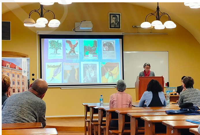
Fot. 2. Prezentacja jednego z wystąpień.