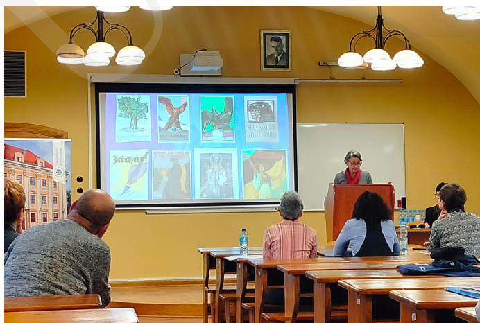
Fot. 2. Prezentacja jednego z wystąpień.