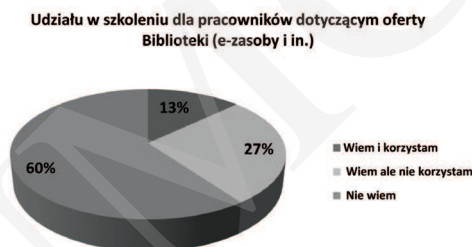
Ryc. 3. Znajomość oferty szkoleniowej dla pracowników.

Oferta Biblioteki Głównej UP w zakresie prowadzenia szkoleń dla pracowników uczelni jest znana mniej niż połowie ankietowanych (40%). Jednak z całej grupy badanych aż 158 zaznaczyło, że nie korzysta z tej oferty szkoleń (ryc. 3). Zachowanie to można tłumaczyć nieznaną ofertą biblioteki bądź własnymi umiejętnościami informacyjnymi użytkowników bibliotek uniwersyteckich. Użytkownicy sprawnie posługujący się informacjami w sieci mogą nie być zainteresowani tą usługą biblioteki. Jednak jak wynika z doświadczenia pracy z użytkownikiem poszukującym informacji naukowej, brak zainteresowania zdobywaniem szerszych umiejętności korzystania z zasobów biblioteki wpływa na wykorzystanie zaledwie ich części.