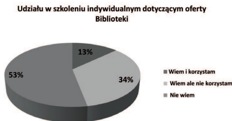
Ryc. 2. Znajomość oferty szkoleniowej dla indywidualnych czytelników.

Analizując kolejne pytanie, zauważono, że duży odsetek (53%) ankietowanych nie zdaje sobie sprawy z możliwości uczestniczenia w szkoleniu indywidualnym dotyczącym oferty biblioteki. Taki wynik wskazuje na potrzebę ciągłego informowania oraz wprowadzenia nowych sposobów na docieranie do użytkowników. Zastanawiające jest także to, że jedynie 13% badanych korzystało z indywidualnego przeszkolenia, co sugeruje konieczność większego otwarcia się bibliotekarzy na przychodzącego czytelnika (ryc. 2).