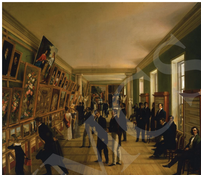
Ryc. 1. Format kieszonkowy – Wincenty Kasprzycki, Widok Wystawy Sztuk Pięknych w Warszawie 1828, 1828 r. , olej na płótnie 94,5 x 111 cm. Muzeum Narodowe w Warszawie.

W większości katalogi są oprawiane w tekturę, często ozdobną, tzw. marmurkową, albo w papier szary i jest to oprawa późniejsza, biblioteczna. Oprawa marmurkowa tekturowa występuje m.in. w Katalogu dzieł sztuk pięknych oraz Katalogu wystawy retrospektywnej nieżyjących malarzy polskich 33 . Były one oprawiane również w oprawy papierowe, czasami barwione na różne kolory. Prezentowane oprawy tekturowe i papierowe miały ograniczone zdobnictwo. Przede wszystkim walory estetyczne oprawy katalogu podnosił kolor tektury lub papieru – barwiono je na brązowo, zielono, niebiesko lub czerwono. Katalogi, jako wydania tzw. proste, obejmujące jedynie tekstową część informacyjną, oprawiano broszurowo 34 .