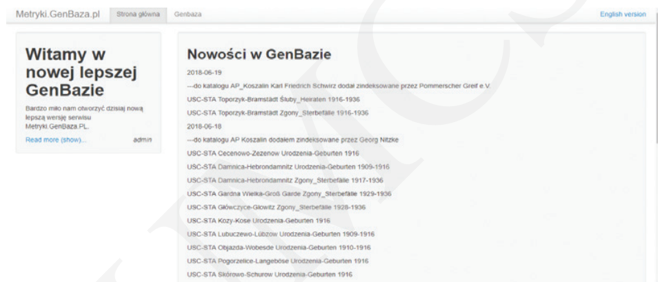
Rys. 3. GenBaza – strona główna.

i prawdziwość powiązania rodzinnego. Aby korzystać z całego zasobu bazy, trzeba się zarejestrować w serwisie Genpol, gdyż daje to możliwość dostępu do większości zeskanowanych metryk. Bez tego do przeglądania udostępnione są tylko dwa archiwa. Podobnie jak w przypadku PomGenBazy, przy korzystaniu z GenBazy nie jest wymagana specjalistyczna wiedza z zakresu genealogii. Wystarczy tylko znajomość kilku zasadniczych słów, wiedza, to, na które wyrażenia zwracać większą uwagę oraz które części aktu zawierają najczęściej potrzebnych informacji.