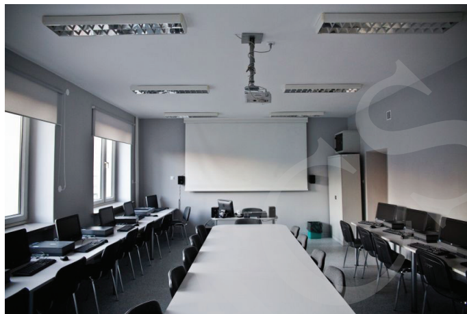
Fot. 1. Humanistyczne Laboratorium Digitalizacji i Wizualizacji Informacji UMCS, fot. www.umcs.pl .

Aby przybliżyć technologię druku 3D studentom i szerszej publiczności, Koło Naukowe Infobrokeringu i Nowych Technologii InfoHunters, działające przy Instytucie zorganizowało warsztaty, podczas których uczestnicy mogli poznać podstawy funkcjonowania drukarki Dexter 3D Ultra. Zdobytą wiedzę wykorzystano następnie podczas Drzwi Otwartych UMCS, odbywających się 24 marca 2017 roku, przeprowadzając pokaz „Urzeczywistnij Swoje Pomysły – Druk 3D Nowym Narzędziem Twojej Wyobraźni” skierowany do kandydatów na studia, którzy odwiedzili Wydział w celu zaznajomienia się z ofertą dydaktyczną.