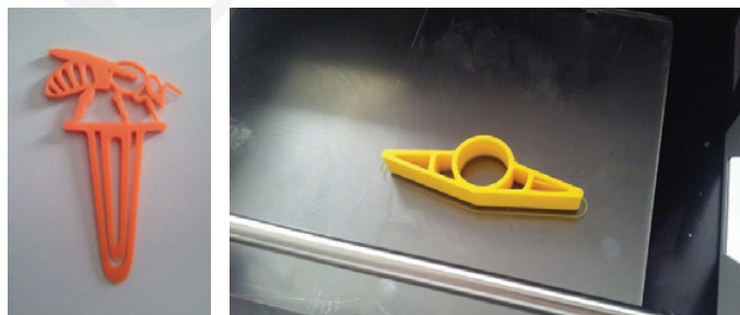
Fot. 5. Wydrukowane przedmioty, fot. Lidia Jarska.

Po zakończeniu pracy wskazane jest, by wydruk pozostał przez kilkadziesiąt sekund na stole do ostygnięcia. Po tym czasie za pomocą szpachelki odrywamy przedmiot. Powstałą rzecz można jeszcze delikatnie wyszlifować papierem ściernym tak, by jej powierzchnia była gładsza.