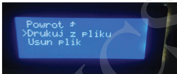
Fot. 4. Wybór akcji pliku.

Zalecana wysokość temperatury to 220°C. Gdy już upewnimy się, że wszystkie wyżej wymienione czynności zostały wykonane, z wyświetlanego menu za pomocą pokrętki wybieramy nazwę projektu i zatwierdzamy wciśnięciem pokrętki.