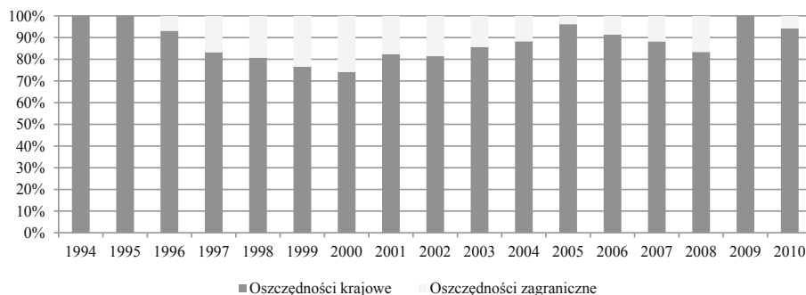
Rysunek 1. Udział procentowy w finansowaniu inwestycji krajowych oszczędności krajowych oraz oszczędności zagranicznych w Polsce w latach 1994–2010

Inwestycje krajowe w Polsce w latach 1994–2010 były w przytłaczającej wielkości finansowane oszczędnościami krajowymi. Stopień pokrycia średniorocznych inwestycji krajowych oszczędnościami krajowymi wynosił w tym okresie średniorocznie około 89%. Zmiany udziału procentowego finansowania inwestycji przez oszczędności krajowe oraz zagraniczne (różnica między inwestycjami krajowymi a oszczędnościami krajowymi) w Polsce w okresie od 1994 do 2010 roku przedstawiono na rysunku 1. Z kolei na rysunku 2 pokazano kształtowanie się inwestycji i oszczędności krajowych w relacji do PKB.