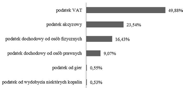
Rys. 1. Struktura planowanych dochodów podatkowych budżetu państwa w Polsce na 2015 r.

Należy zauważyć, że podatek VAT jest najbardziej dochodowym podatkiem w budżecie państwa polskiego (rys. 1). Na 2015 r. z tytułu podatku VAT zaplanowano wpływy w wysokości 134 630 000 tys. zł, co stanowi 49,88% łącznych wpływów podatkowych do budżetu państwa.