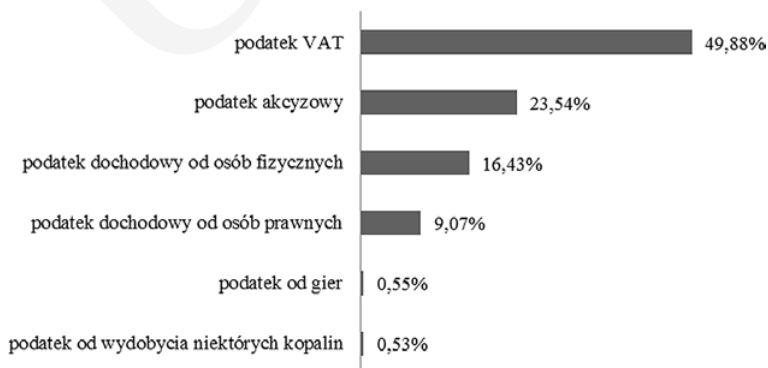
Rys. 1. Struktura planowanych dochodów podatkowych budżetu państwa w Polsce na 2015 r.

Należy zauważyć, że podatek VAT jest najbardziej dochodowym podatkiem w budżecie państwa polskiego (rys. 1). Na 2015 r. z tytułu podatku VAT zaplanowano wpływy w wysokości 134 630 000 tys. zł, co stanowi 49,88% łącznych wpływów podatkowych do budżetu państwa.