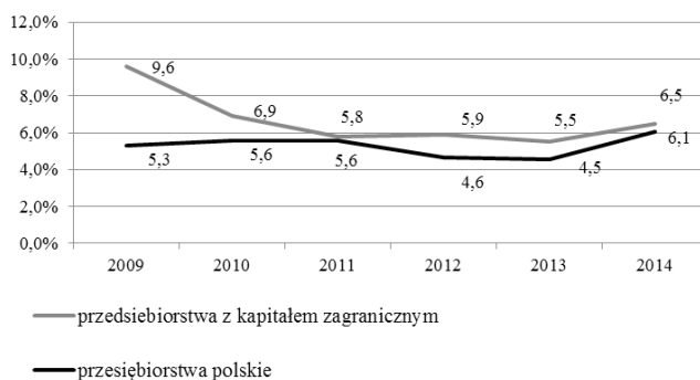
Rys. 2. Wskaźnik intensywności inwestowania przedsiębiorstw według struktury własnościowej w województwie łódzkim w latach 2009–2014 (w %)

Zdecydowanie odmienny obraz aktywności inwestycyjnej przedsiębiorstw z kapitałem zagranicznym dostarcza analiza syntetycznego wskaźnika intensywności inwestowania. Wskaźnik ten obliczono jako relację poniesionych nakładów inwestycyjnych na zakup środków trwałych do wartości, uzyskanych przez badane grupy przedsiębiorstw, przychodów z całokształtu działalności (rys. 2).