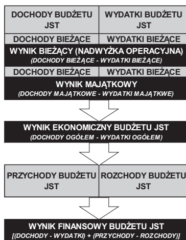
Rys. 1. Elementy równoważenia budżetu JST