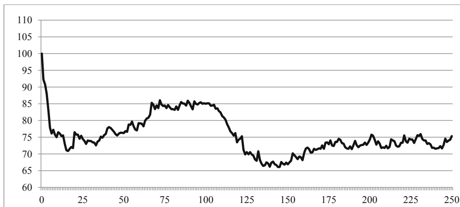
Rysunek 2. Średni kurs akcji po scaleniu

Pozostałe akcje o najniższych możliwych cenach notowały skokowe wahania o 1 grosz. Wśród nich cena FON-u i Elkopu oscylowała między 1 a 2 groszami, Sanwilu 4–5 groszami, a PC Guarda 2–4 groszami. Ponadto akcje Mewy przez cały okres przed scaleniem notowano po cenie 1 grosza (oferty podażowe po cenie 1 grosza nie były nawet zaspokojone).