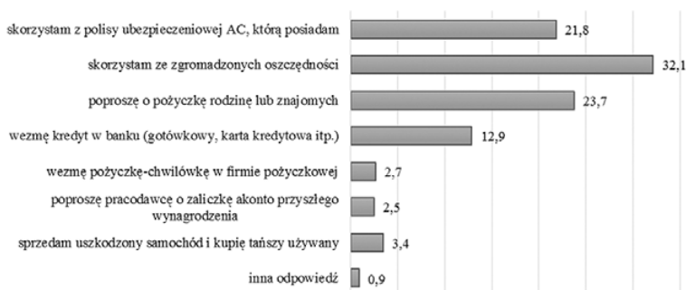
Rys. 2. Źródła finansowania nieprzewidzianych wydatków przez Polaków