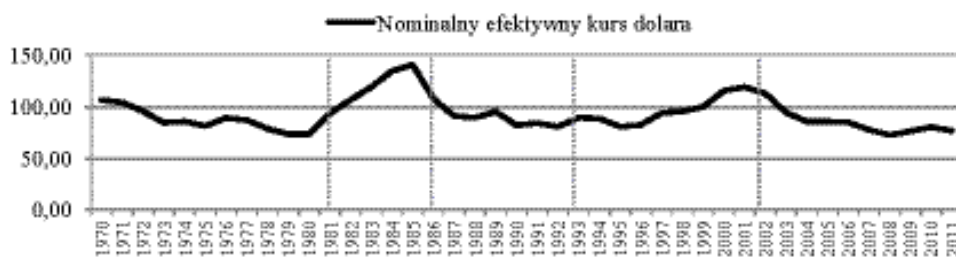
Rysunek 1. Nominalny efektywny kurs dolara amerykańskiego (12 partnerów handlowych, rok 1999 = 100)

Kurs walutowy nie jest więc podstawowym celem polityki FED, jednak takie instrumenty, jak: luzowanie ilościowe ( quantitative easing ), bodźce fiskalne ( fiscal stimulus ) czy redukcja zadłużenia mogą wpływać na jego poziom, przyczyniając się do realizacji założonych celów makroekonomicznych [Elwell, 2011, s. 16–17]. Okazjonalnie jednak rząd Stanów Zjednoczonych podejmuje działania bezpośrednio oddziałujące na kurs dolara (m.in. zapowiedzi słowne interwencji na rynku walutowym). Ponadto polityka rządu, programy gospodarcze i instytucje, które mają na celu wzmocnienie potencjału gospodarki amerykańskiej, pośrednio wywierają również pozytywny wpływ na dolara.