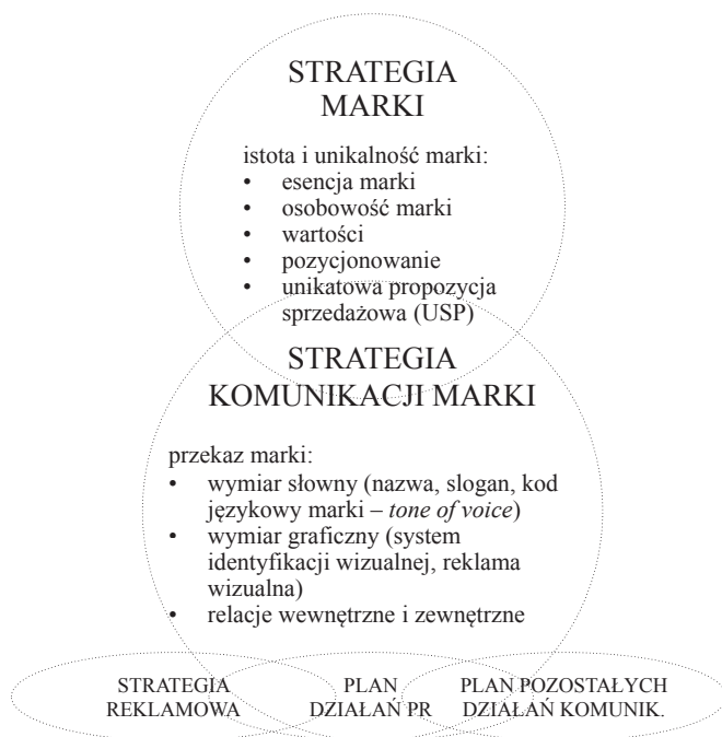
Rysunek 3. Strategia marki a strategia komunikacji marki

Komunikacja na poziomie werbalnym to specyficzny język marki, jej wymiar słowny. Najbardziej oczywistym elementem tego języka jest nazwa marki, która powinna odbiorcom czytelnie prezentować esencję marki. Oprócz wyboru nazwy marki i sloganu należy ustalić tzw. kod językowy marki ( tone of voice ), który jest zbiorem reguł rządzących stylem komunikacji werbalnej. Chodzi na przykład o dobór słownictwa używanego w komunikacji marki, sposób pisania tekstów reklamowych, itp.