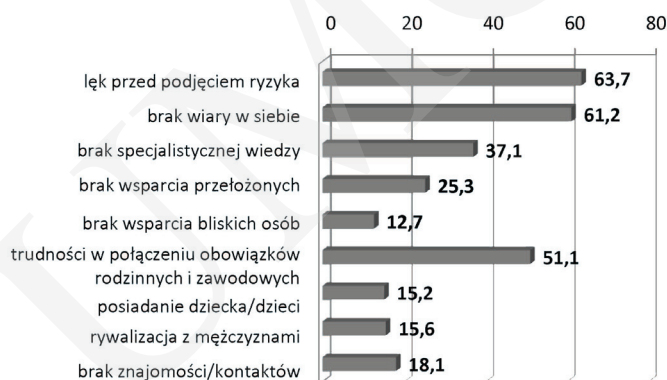
Rys. 7. Opinia kobiet na temat czynników utrudniających awans na stanowisko kierownicze (w %)

Brak wiary w siebie to jednocześnie chyba najtrudniejsza bariera, ponieważ zmiana samooceny kobiet, podnoszenie ich niskiej samooceny (jako „gorszego pracownika”, który nie poradzi sobie z wyzwaniami) utrwalanej przez lata, jest rzeczywiście wyzwaniem.