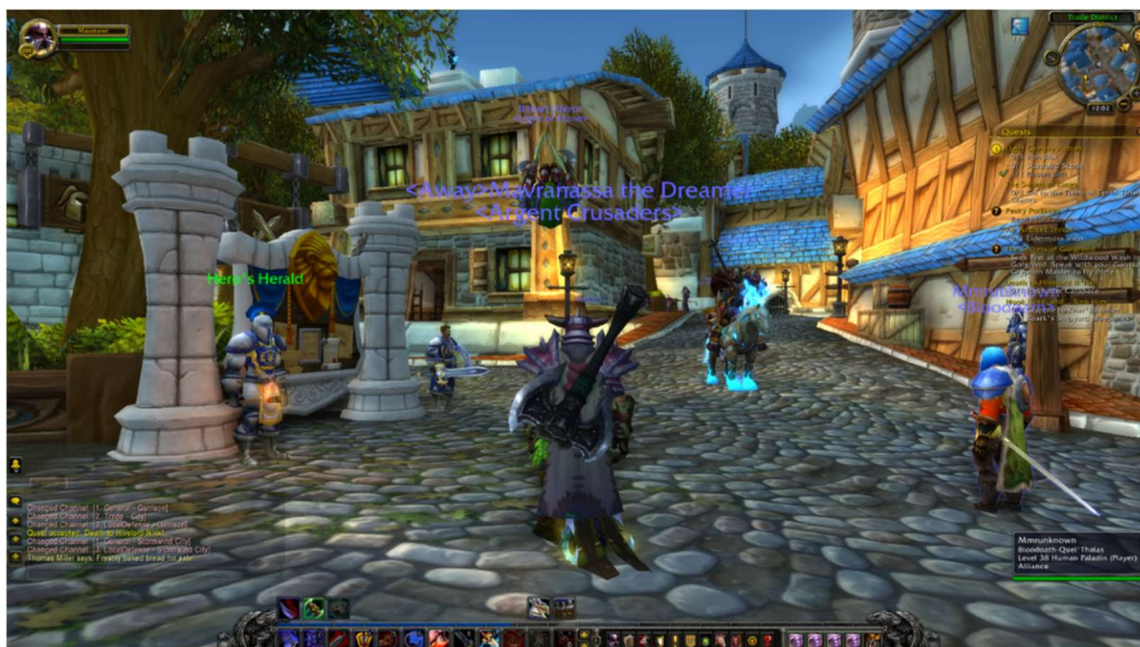
Stormwind, World of Warcraft

„zamieszkuje miasto”, jego konkretyzacją jest mieszkaniec, który porusza się w strukturze miejskiej, wystawiony na rozmaitego rodzaju oddziaływania.