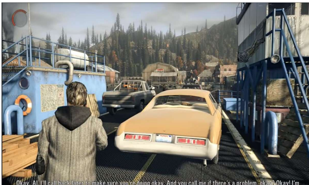
Bright Falls, Alan Wake

ścina za dnia, ale po zmroku zmienia się w teatr grozy i absurdu, z którego bohatera ratują tylko rozprasające mrok światło latarki i odwracający sen termos z kawą.