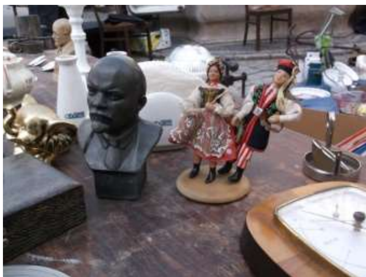
Fot. 9. Lenin i Krakowiaczy

Nasze znaczki jak i inne przedmioty swoją obecnością wikłają Rynek dzisiejszej Giełdy w niezliczoną ilość własnych powiązań przyczyn i skutków, znaczeń i wartości z równie niezliczoną ilością innych miejsc i czasów mniej lub bardziej odległych. Zgromadzone na Rynku przedmioty stanowią także rozmaite relacje między sobą. Przybysze ze Wschodu rozglądają się po Rynku wśród innych ceramicznych figurek (Fot. 5), Budda odpoczywa wśród Madonn (Fot. 6), a Lenin spotyka się z Krakowiakami (Fot. 9).