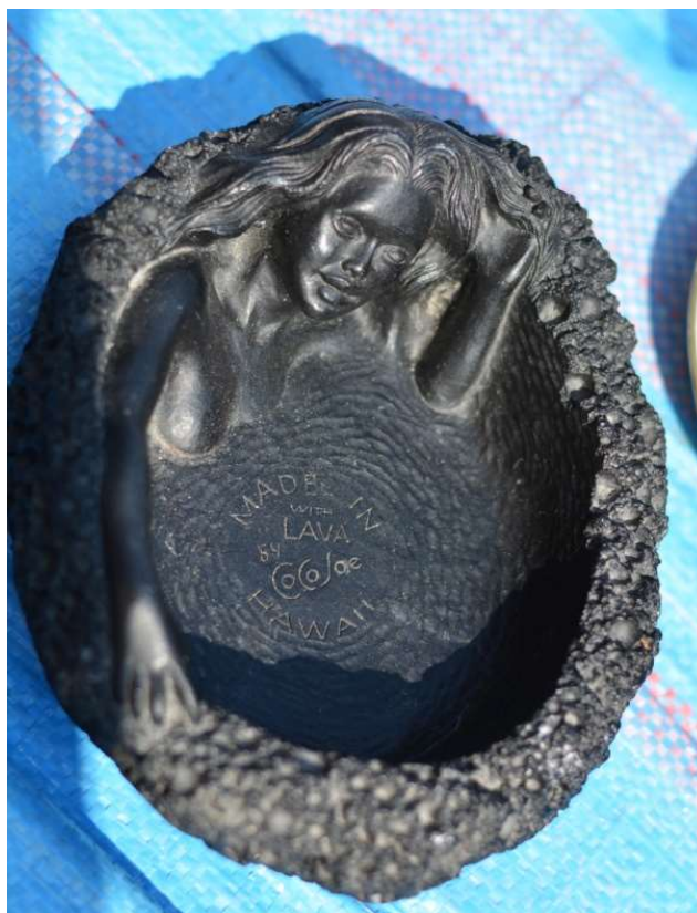
Fot. 7. Popielniczka

Dzięki katalogowi 8 dowiemy się, że kobieta z Amberley to Wiktoria, królowa Wielkiej Brytanii, do której Nowa Zelandia należała, gdy znaczek stemplowano. Dowiemy się też, że znaczek wydrukowano w Government Printing Office w Wellington na Wyspie Północnej w 1882 r. a zaprojektowano w 1874 r. w firmie Thomas De La Rue & Co. w Basingstone w Anglii. Uwikłanie znaczka nie dotyczy tylko czasu i miejsca ostemplowania. Są inne miejsca i czasy ważne dla jego istnienia i posiadanych przez niego własności, znaczeń, wartości. Nie byłoby go tutaj, gdyby nie został w 1882 r. wydrukowany w Wellington w firmie mieszczącej się w budynku na rogu Lambton Quay i Bunny Street, którą kierował George Didsbury. Nie byłoby go też, gdyby 8 lat wcześniej nie został zaprojektowany w angielskim mieście w firmie Thomasa De La Rue. Swoją nominalną wartością znaczek uwikłany jest w brytyjski system pieniężny, używany na Wyspach od średniowiecza do 1971 r. Wartość dwóch pensów związana jest z wartością jednego. Z kolei jeden pens to 1/12 szylinga, skoro szyling to 12 pensów.