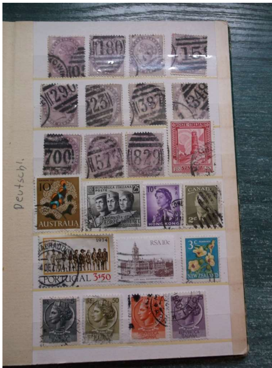
Fot. 3. Jedna ze stron

z różnych krajów świata. Belgia sąsiaduje z Indiami, Argentyna leży obok Szwajcarii, gdzie indziej Włochy, Chile oraz Szwecja, Turcja i Kanada. Ta specyficzna topografia czyni z albumu niepowtarzalny przedmiot i miejsce swoiste. Staje się on też szczególnym odwzorowaniem świata.