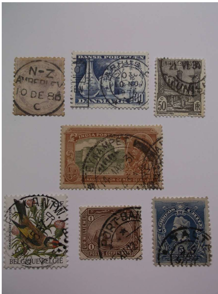
Fot. 4. Znaczki

plowania. W jakiej kolejności? Od najstarszego do najnowszego, a może od najmniejszego do największego? Od tego, który przebył najdłuższą drogę? Niech będzie kolejność z fotografii. To małe skrawki papieru. Największy w środku ma rozmiar 2,5 x 4 cm. Ten poniżej to 2 x 2,5 cm.