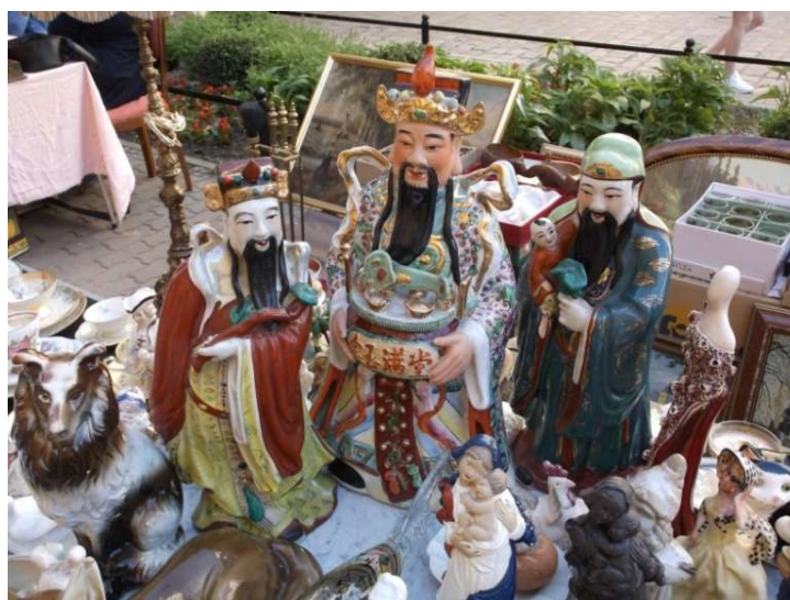
Fot. 5. Przybysze ze Wschodu

znaczki wraz z wieloma innymi przedmiotami na świdnickim Rynku w specyficzny sposób wychodzą naprzeciw postulatam autorek. Przybyły tu z różnych miejsc. Mniej lub bardziej odległych. Kiedyś były ich integralną częścią, a teraz są elementem świdnickiego spotkania, nie tracąc związków z miejscami pochodzenia i poprzedniego pobytu. I nadal są fragmentami tych miejsc. Stanowią więc między lokalnością Rynku i wieloma innymi lokalnościami różnych regionów świata. Znaczki nie są tu wyjątkiem. Czynią to z ogromem innych przedmiotów obecnych tu w tą niedzielę. Na przykład na innym stoisku wśród ceramicznych figurek, z których dzięki sygnaturom można odczytać miejsca produkcji i pochodzenia stoją i rozglądają się trzy orientalne postacie. Nie odnalazłem przy nich żadnych oznaczeń produkcji, lecz przypuszczam, że są przybyszami z dalekiego wschodu świdnickiego Rynku.