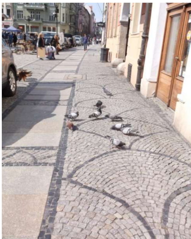
Fot. 8. Gołębie

Na kolejnym znaczku widzimy szczygła. Ptaki te wraz z ludźmi rozprzestrzeniły się na Euroazję, Afrykę, Australię i Amerykę Południową. Ten przybył z Borsbeek w południowo-wschodniej Antwerpii, gdzie pojawił się na tym znaczku wyemitowanym 11 lutego 1985 r. Nie jest jedynym ptakiem na naszym Rynku. Niedaleko spacerują po bruku mniej kolorowe ale żywe gołębie, zamieszkujące jak szczygły rozległe i odległe od siebie regiony świata. Rynek jest zatem miejscem spotkania także i różnych ptaków.