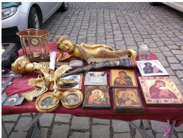
Fot. 6. Budda z Madonnami

Przedmioty te nie straciły związków z miejscami swego powstania, bo gdyby nie te miejsca, nie byłoby częścią świdnickiego Rynku. Na Madonnach widać farby z tamtych miejsc, a czasem i specyficzny sposób ich nakładania. Znaczki mają na sobie tusz pobrany stemplem z leżącej obok niego poduszki i nadal odcisnięty jego specyficzny kształt. Ogrom przedmiotów i ich powiązań z innymi miejscami wiąże Rynek z ogromem innych miejsc na Ziemi na wszystkim zamieszkałych przez człowieka kontynentach, czyniąc w swoisty sposób Rynek światem, a świat Rynkiem.