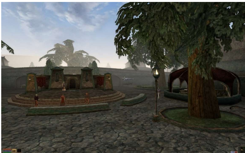
Mournhold, The Elder's Scrolls III: Morrowind

Przytoczone motywy mitologiczne są charakterystyczne dla pozytywnej, lunarnej symboliki miasta. Ma ona jednak także swój negatywny aspekt, związany z archetypem Strasznej Matki, kojarzonej ze śmiercią, pochłanianiem, ćwiartowaniem, niszczeniem, gniciem 10 . Ta ambiwalencja jest nieraz ujmowana jako przeciwstawienie dwóch stron miasta. Jak podaje Neumann: