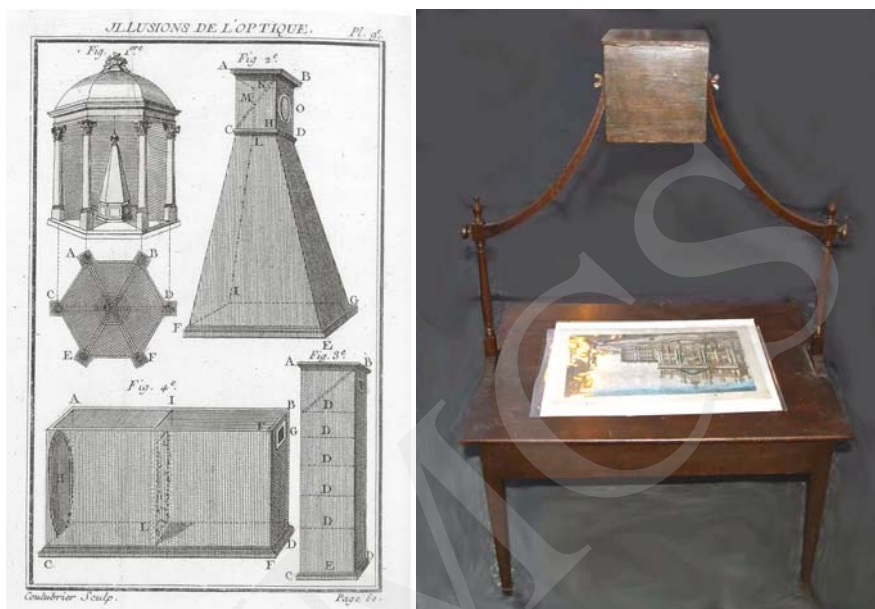
Ilustracja 4. Rémi-Claude Coulluber, Illusions de l'optique , grafika 1769, z dzieła Edme Gilles'a, Novuelles récerération physiques et matematicques... , wyd. Paryż 1969-70, vol. 3. Ilustracja 5. Zograscopie w formie biurka.

Tak jak konstrukcja zograscopie wydaje się zadziwiająco prosta, to działanie optycznego agregatu vue d'optique-zograscopie jest zdumiewająco złożone. Z jednej strony zograscopie wprowadza dywersję, zakłócając i minimalizując sygnały sensoryczne informujące o rzeczywistej płaszczyźnie kartonów vue d'optique 4 , z drugiej strony wysyła własne sygnały symulujące w umyśle widza wrażenia wirtualnej przestrzeni, do złudzenia przypominającej odczucia trójwymiarowej fizycznej przestrzeni, w której zlokalizowane są nasze ciała.