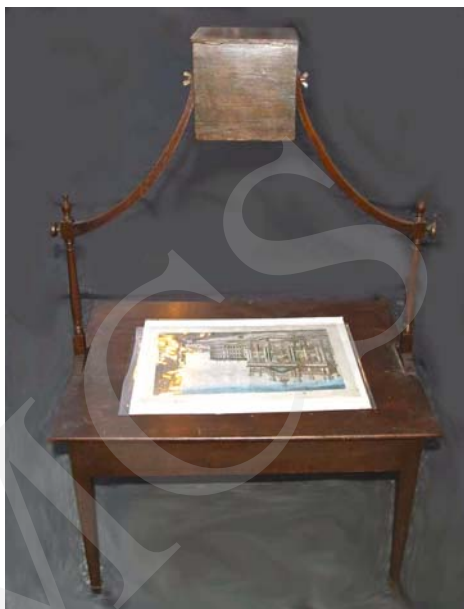
Ilustracja 4. Rémi-Claude Coulluber, Illusions de l'optique , grafika 1769, z dzieła Edme Gilles'a, Novuelles récerération physiques et matematicques... , wyd. Paryż 1969-70, vol. 3. Ilustracja 5. Zogrscope w formie biurka.

Tak jak konstrukcja zogrscope wydaje się zadziwiająco prosta, to działanie optycznego agregatu vue d'optique-zogrscope jest zdumiewająco złożone. Z jednej strony zogrscope wprowadza dywersję, zakłócając i minimalizując sygnały sensoryczne informujące o rzeczywistej płaszczyźnie kartonów vue d'optique 4 , z drugiej strony wysyła własne sygnały symulujące w umyśle widza wrażenia wirtualnej przestrzeni, do złudzenia przypominającej odczucia trójwymiarowej fizycznej przestrzeni, w której zlokalizowane są nasze ciała.