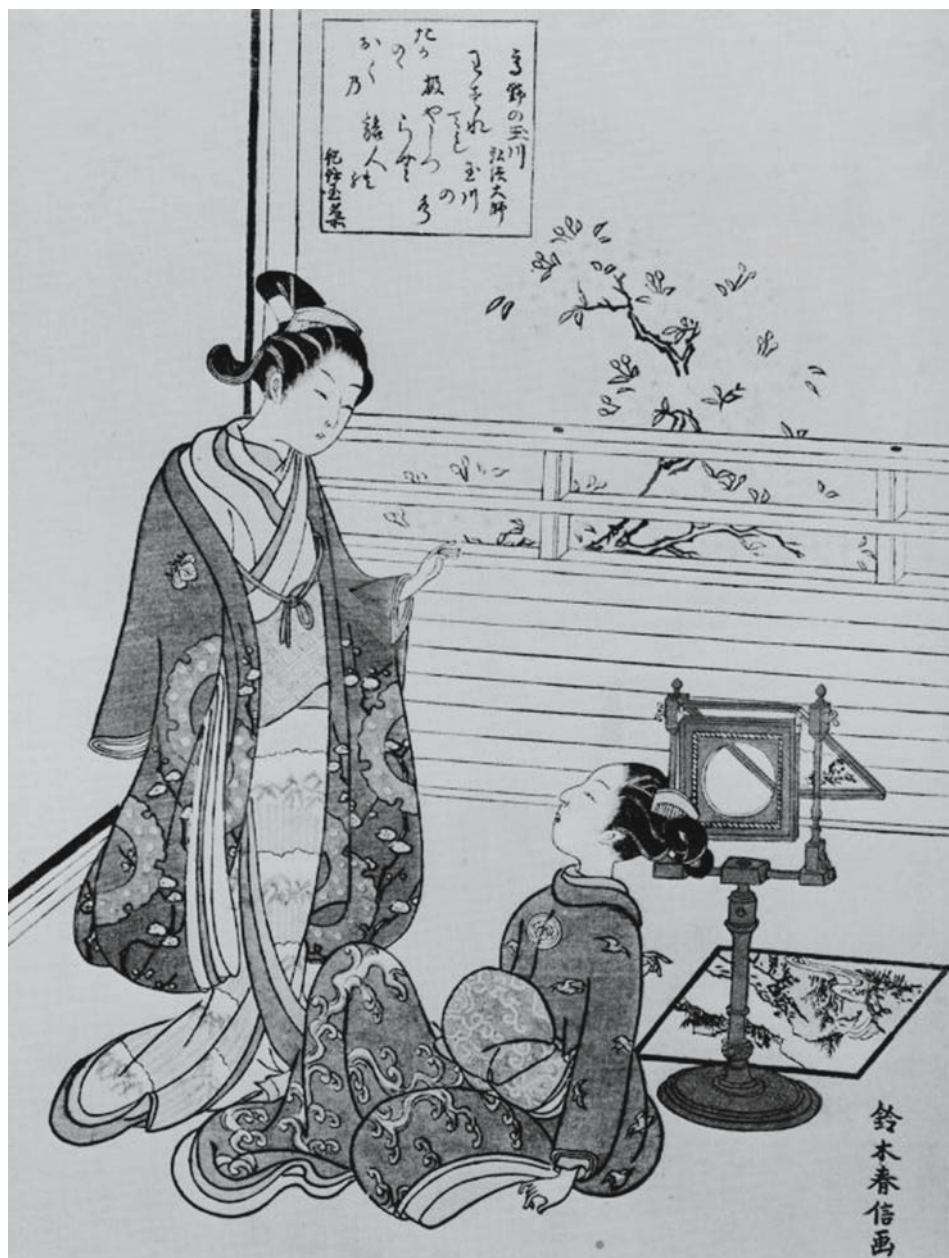
Ilustracja 11. Suzuki Harunobu (1725?-1770), Dwie piękne dziewczyny z zogrscope , drzeworyt koniec lat 1760(?).