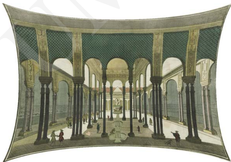
Ilustracja 6. Dziedziniec Lwów w pałacu Maurów w Grenadzie, grafika ok. 1760. Symulacja efektu zniekształcenia grafiki przez pozorne, żaglaste ugięcia jej powierzchni w optyce dwustronnie wypukłej soczewki (na podstawie reprodukcji).

W percepcji widza tworzy się wrażenie trójwymiarowego menisku wklęsłego. Centrum grafiki cofa się, krawędzie występują do przodu, naroża unoszą się pozornie ku widzowi. Daje to efekt wycinka hemisferycznej dioramy (zob. il. 6). Rezultat ten znacznie zwiększa u widza poczucie rzekomej trójwymiarowości przestrzeni 8 .