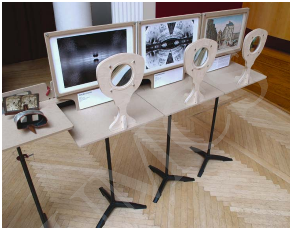
Ilustracja 12. Wystawa ART & CODE: DIY 3D Sensing and Visualization (fragment) 43 .

Ilustracja nr 12 przedstawia właśnie jedno z takich wydarzeń. To fragment wystawy towarzyszącej festiwalowi i konferencji naukowej ART & CODE: DIY 3D Sensing and Visualization , która odbyła się w dniach 21-23 listopada 2011 roku w Carnegie Mellon University w Pittsburgu, zorganizowanej przez Art & Code 3D – laboratorium badań nietypowych i interdyscyplinarnych, prowadzonych na pograniczu sztuki, nauki, kultury i technologii. Tematem jej były problemy artystyczne, techniczne, taktyczne i kulturowe, jakie niosą ze