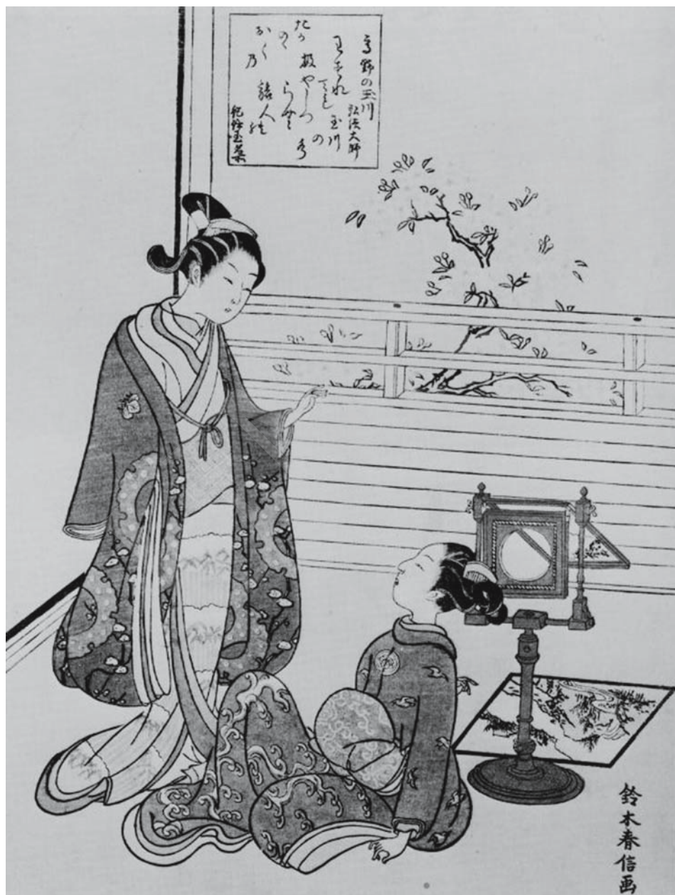
Ilustracja 11. Suzuki Harunobu (1725?-1770), Dwie piękne dziewczyny z zograscope , drzeworyt koniec lat 1760(?).