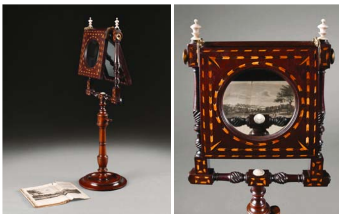
Ilustracje 1 i 2. Zograscope , model salonowy, Anglia, ok. 1770, obecnie w zbiorach Muzeum Pałac w Wilanowie.

Zograscope to zadziwiające urządzenie optyczne, stworzone do generowania „wirtualnych obrazów 3-D”. Wizualizują się one w okulusie zograscope . Nie można ich jednak sfotografować przestrzennie, w trójwymiarowej postaci bowiem istnieją tylko w postrzeżeniu widzów. Przy czym nie są to wizje o charakterze marzeń sennych, hipnozy czy halucynacji, bo natura ich pochodzenia jest techniczna. Źródłem inicjującym ich wywoływanie jest działanie optycznej maszyny zograscope .