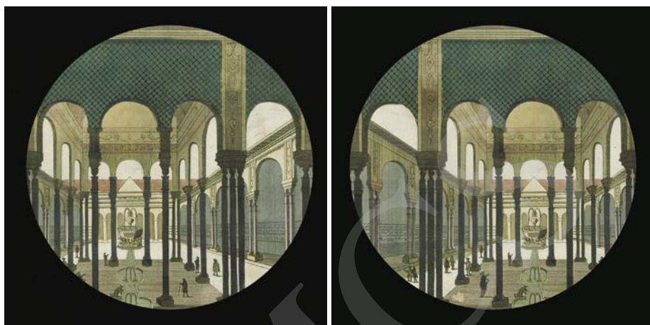
Ilustracja 7. Pole widzenia lewego oka. Ilustracja 8. Pole widzenia prawego oka.

Jednak najważniejsze zadanie soczewki zograscope nie polega na typowym wykorzystaniu jej jako szkła powiększającego. Zograscope w sposób bardzo twórczy preferuje w działaniu inną cechę obustronnie wypukłej soczewki. Wykorzystuje jej skrajne obszary, położone wzdłuż horyzontu wzroku jako dwa przeciwnie skierowane pryzmaty 12 .