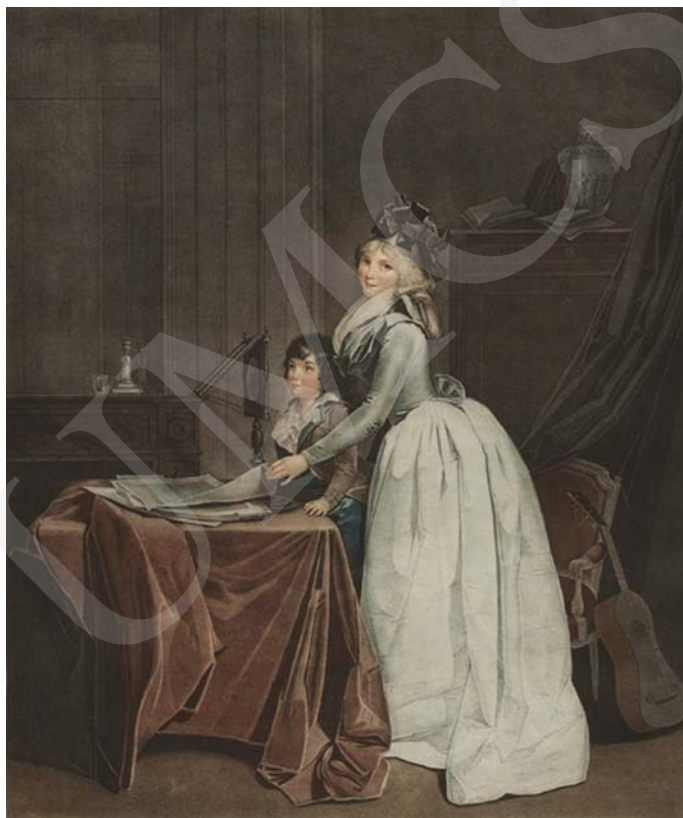
Ilustracja 3. Louis Leopold Boilly (1761-1845), L'optique .

ne zespolone są korpusem, który wynosi je ponad powierzchnię ekspozycji grafiki na około 45 cm 3 . Dzięki temu osoba siedząca przy stole patrzyła na wprost przez obiektyw na lustrzane odbicie grafiki leżącej płasko na blacie w zasięgu jej ręki, co jest najkorzystniejsze z punktu widzenia skuteczności działania optyki urządzenia i ułatwia przekładanie kolejnych obrazów (zob. il. 3).