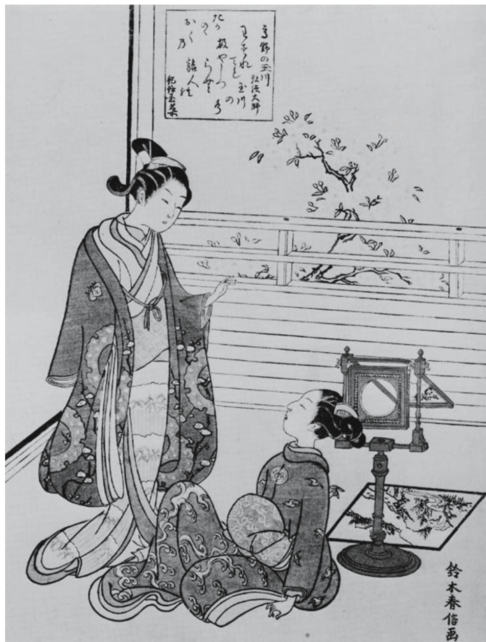
Ilustracja 11. Suzuki Harunobu (1725?-1770), Dwie piękne dziewczyny z zoograscope , drzeworyt koniec lat 1760(?).