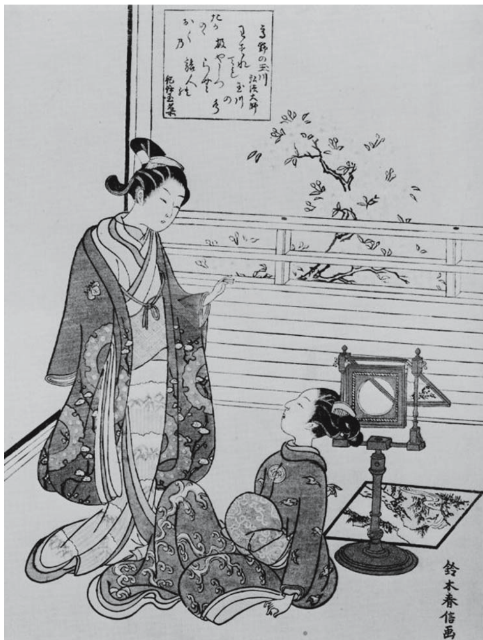
Ilustracja 11. Suzuki Harunobu (1725?-1770), Dwie piękne dziewczyny z zoograscope , drzeworyt koniec lat 1760(?).