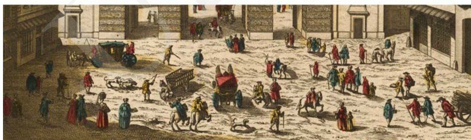
Ilustracja 10. Widok Paryża, brama Saint Martin, vue d'optique 31x45 cm, ok. 1760.

Kolejny efekt pozorowania przestrzenności grafiki przez zograscope związany jest z powszechną praktyką podkolorowywania vue d'optique , co nie jest zabiegiem czysto ornamentalnym. Powstaje dzięki temu efekt chromostereopsis – wrażenie głębi przestrzennej osiągnięte w dwuwymiarowych obrazach, na skutek zestawiania ze sobą kolorów odległych na skali „temperaturowej” barw 15 . Relatywne różnice temperatury barw przekładane są na wrażenie dystansu do oka obserwatora. Szczególnie aktywnie działają w tym kierunku skrajne zestawienia: czerwony – niebieski,