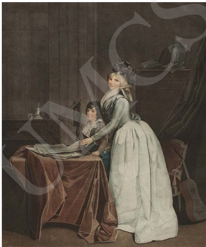
Ilustracja 3. Louis Leopold Boilly (1761-1845), L'optique .

ne zespolone są korpusem, który wynosi je ponad powierzchnię ekspozycji grafiki na około 45 cm 3 . Dzięki temu osoba siedząca przy stole patrzyła na wprost przez obiektyw na lustrzane odbicie grafiki leżącej płasko na blacie w zasięgu jej ręki, co jest najkorzystniejsze z punktu widzenia skuteczności działania optyki urządzenia i ułatwia przekładanie kolejnych obrazów (zob. il. 3).