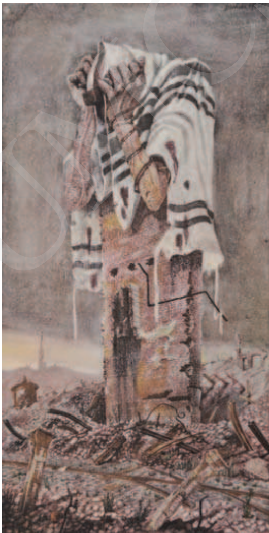
Ilustracja 4. Bronisław Wojciech Linke, El mole rachmim , 1946, z cyklu Kamienie krzyczą .

dookoła ręki, zrozpaczony, modlący się Żyd, jest owym „krzyczącym kamieniem” – fragmentem zrujnowanego domu, w pogorzelisku pogiętych tramwajowych szyn, w ruinach getta. Szczątki kamienicy przyjęły ludzkie kształty. Spersonifikowana budowla to wizerunek nie tylko zrujnowanej stolicy; w obliczu wielkich strat jest także sygnałem, że nie wszystko zostało utracone. Pozostał człowiek. Obraz Linkego, reprodukowany w licznych publikacjach poświęconych holocaustowi, można odczytać wielorako: jako hołd dla poległych, upamiętnienie ludzkich tragedii, głos lamentu, wreszcie bogaty w treści, metaforyczny komentarz autorski.