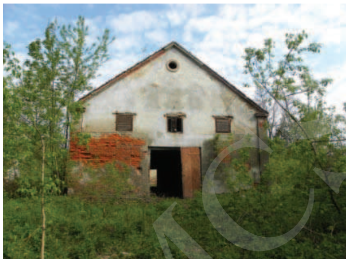
Ilustracja 5. Budynek magazynu – elewacja południowa, fot. M. Dudkiewicz (2012).