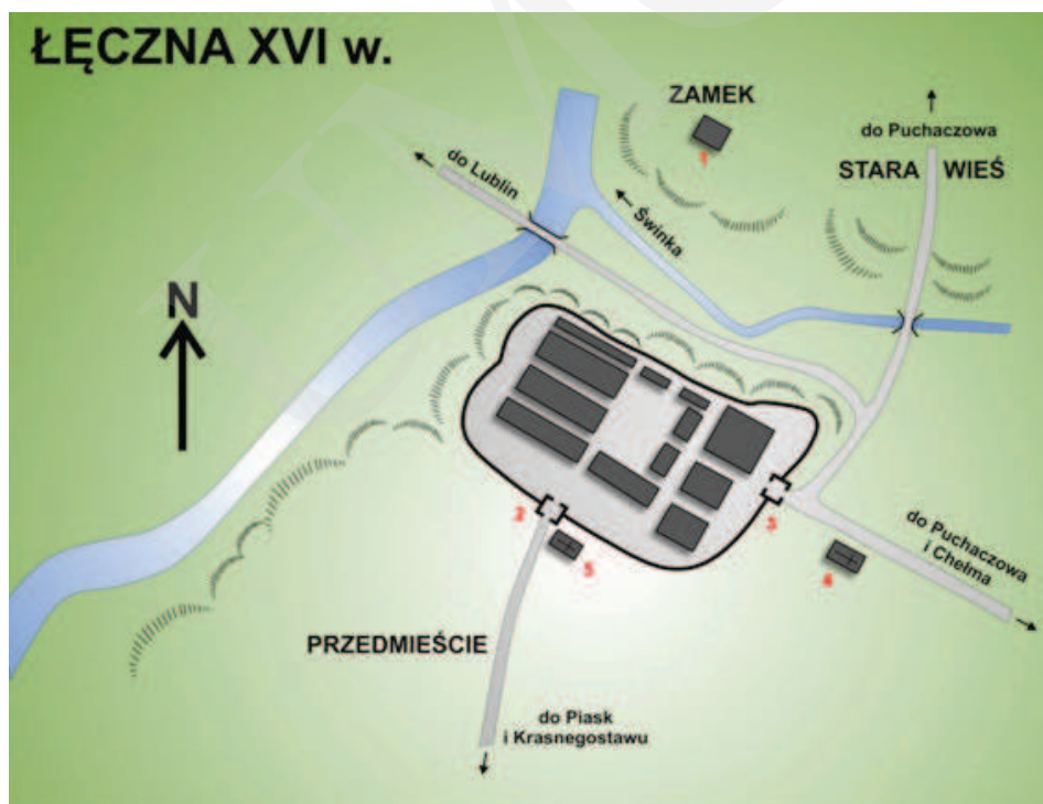
Ilustracja 1. Rekonstrukcja układu przestrzennego miasta Łęczna w XVI wieku. 1 – Zamek; 2 – Brama Krasnostawska; 3 – Brama Chełmska; 4 – Kościół parafialny; 5 – Kościół szpitalny Św. Ducha, oprac. M. Dudkiewicz, wg Maciuka, [w:] Łęczna. Studia z dziejów miasta , red. E. Horoch, Łęczna 1989, s. 38.

Pierwsza wzmianka o Łęcznej – z pisownią Łaczna – pochodzi z 1252 roku. Była to wówczas własność opactwa sieciechowskiego, a później, w roku 1428, Stefana z Łęcznej. Ziemie łączyńskie leżały na granicy wpływów Małopolan, pomiędzy województwem chełmskim i Księstwem Halicko-Wołyńskim, co prawdopodobnie było przyczyną wzniesienia na skraju wysokiego ujścia Świnki do Wieprza zamku obronnego 1 (zob. il. 1). 7 stycznia 1467 roku Kazimierz Jagiellończyk nadał Łęcznej prawa miejskie. Miasto osadzono na 36 łanach na skrzyżowaniu dwóch szlaków handlowych: z Wołunia do Lublina, i z Podkarpacia na Podlasie 2 .