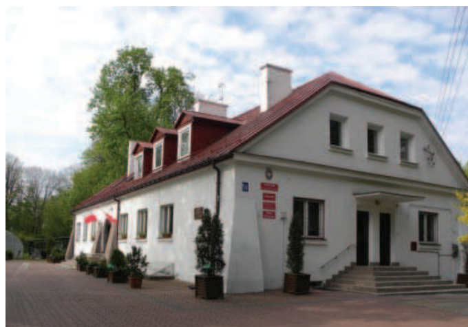
Ilustracja 4. Budynek dworu – elewacja północna, fot. M. Dudkiewicz (2012).