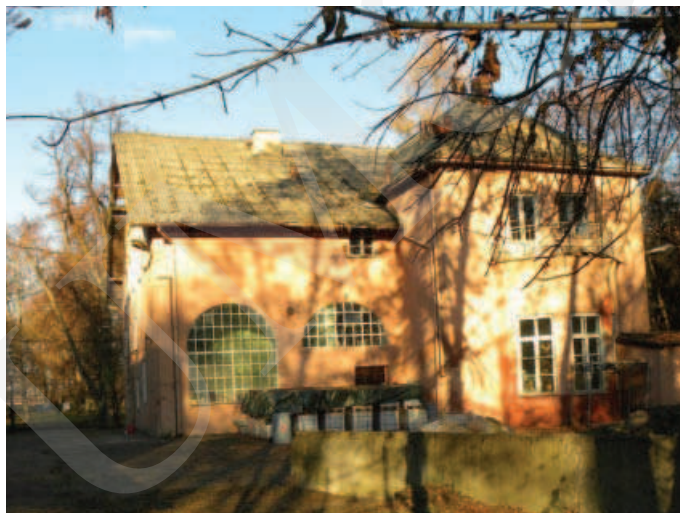
Ilustracja 3. Budynek pałacu – elewacja południowa, fot. M. Dudkiewicz (2012).

Ogólna inwentaryzacja architektoniczna przeprowadzona w 2012 roku (zob. il. 3-6) wykazała, że budynek z roku 1881 jest w stanie ruiny. Obiekt ten był wzniesiony na planie prostokąta, z dachem dwuspadowym, ścianami wykonanym z cegły i opoki wapiennej, naprożami okien ceglany i łukowymi. W sąsiednim budynku – suszarni – jest zachowane deskowanie więźby dachowej, w kształcie koperty, z zewnątrz dach dwuspadowy. W magazynie układ dachu płatwiowo-kleszczowy, kleszcze w przekroju okrągłym, z bali. Strop opiera się na drewnianych słupach, ściany murowane z cegły dziurawki. Dach nakryty eternitem z zaakcentowanymi narożnikami.