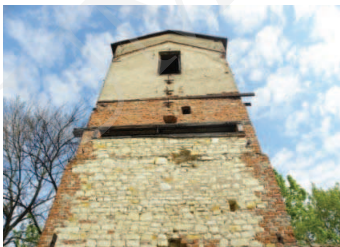
Ilustracja 6. Budynek suszarni chmielu – elewacja południowa, fot. M. Dudkiewicz (2012).

Przeprowadzone analizy wskazują na brak opieki i niszczące zmiany w substancji zabytkowej parku i budynków zespołu dworskiego w Łęcznej. Inwentaryzacja ukazała zarastanie parku krajobrazowego, gdzie drzewa i krzewy tworzą niekontrolowane, przypadkowe skupiska oraz niszczące budynki folwarku. Niewątpliwie jednak obiekt zasługuje na uwagę ze względów historycznych, przyrodniczych oraz jako zabytek sztuki ogrodowej.