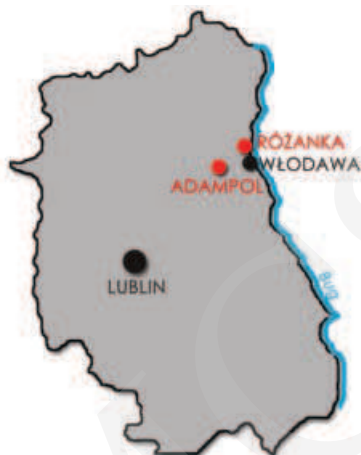
Ilustracja 1. Lokalizacja zespołu pałacowego w Różance i Adampolu na tle aktualnych granic Województwa Lubelskiego, 2014 (oprac. M. Boguszewska)