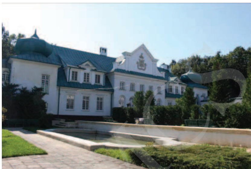
Ilustracja 12. Pałac w Adampolu.