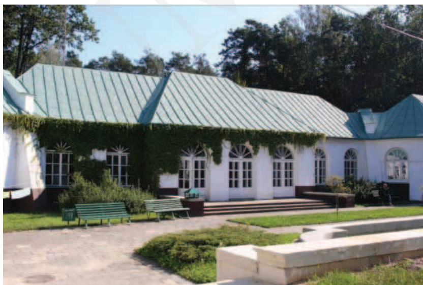
Ilustracja 13. Budynek oranżerii – zespół pałacowy w Adampolu.