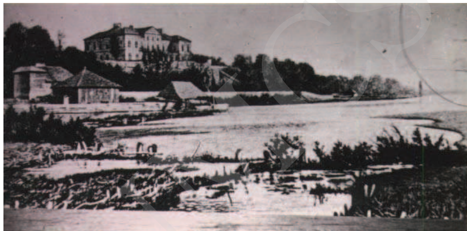
Ilustracja 2. Reprodukacja malowidła ściennego w pałacu w Adampolu. Stan pałacu w Różance po I wojnie światowej.

W roku 1972 wydano dokument o przekazaniu prawie 9 ha obejmujących park w Różance na Muzeum Wsi Lubelskiej, jednak decyzja ta nigdy nie weszła w życie, a tereny pozostały do dyspozycji Urzędu Gminy. Przez pewien okres urządzano na terenie parku obozy harcerskie i kolonie, a w latach 70. XX wieku na południowym obrzeżu założenia rozpoczęto budowę Domu Spokojnej Starości oraz budynków mieszkalnych 23 .