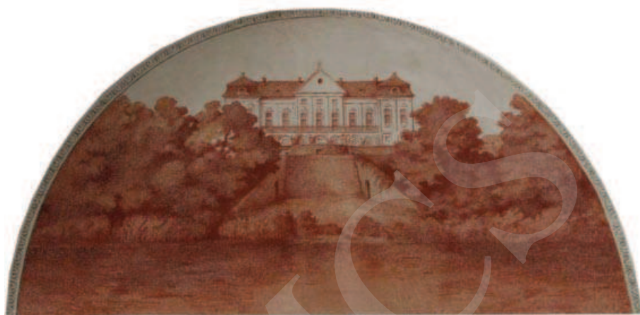
Ilustracja 4. Widok na pałac od doliny Bugu – malowidło w pałacu w Adampolu. (Fot. M. Boguszewska 2014)