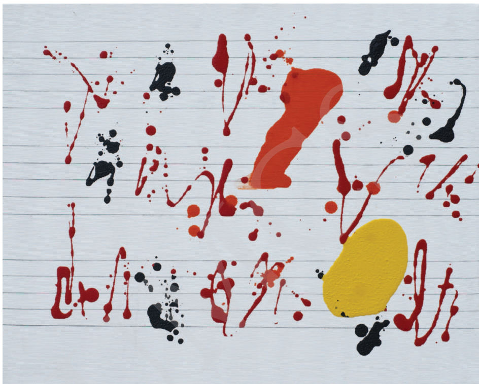
Ilustracja 3. W. Pawlak, Partytura do baletu Sokrates XXXXXXXXXVIII , 2008, 40x50 cm, fot. K. Kuzko