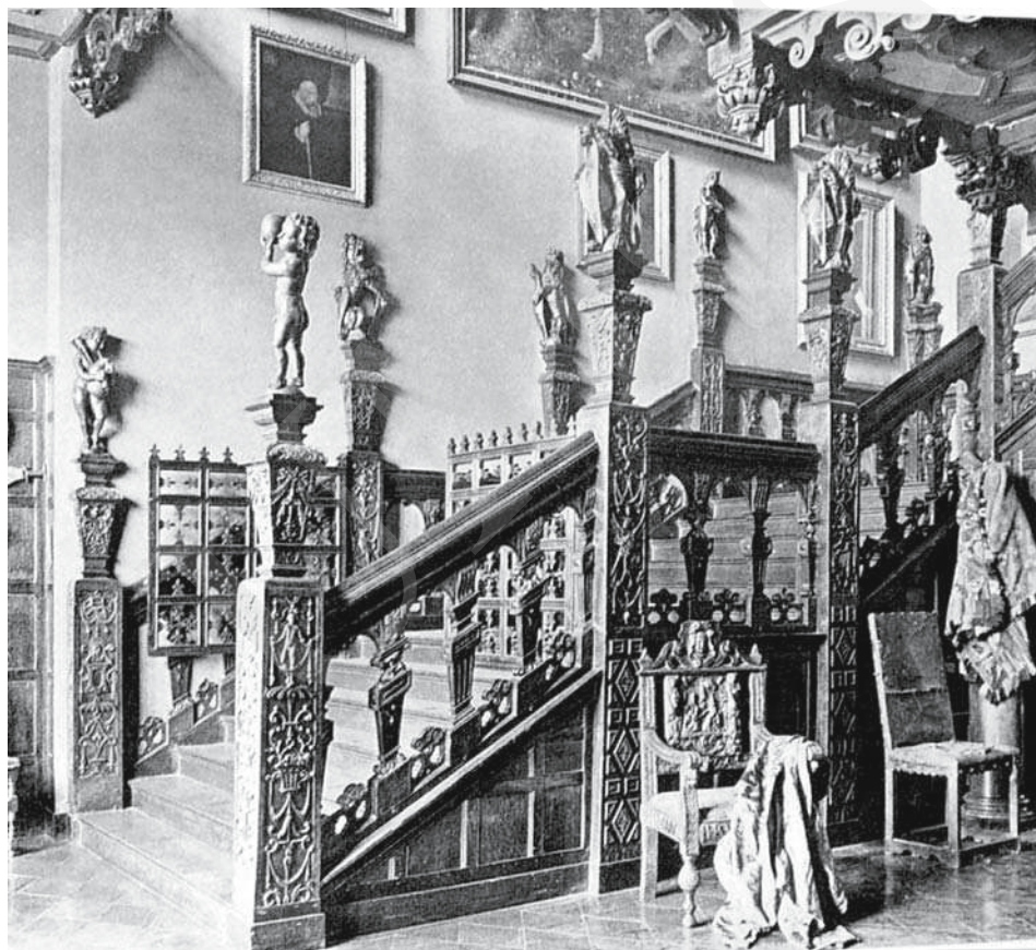
Il. 13. Hatfield House , klatka schodowa. Repr. z: Ch. Latham, In English Homes , Coventry 1904, s. 113.