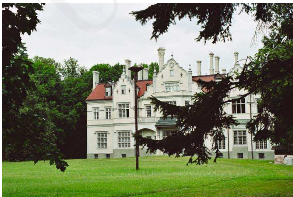
Il. 4. Pałac w Jabloniu, elewacja frontowa. lipiec 2005.