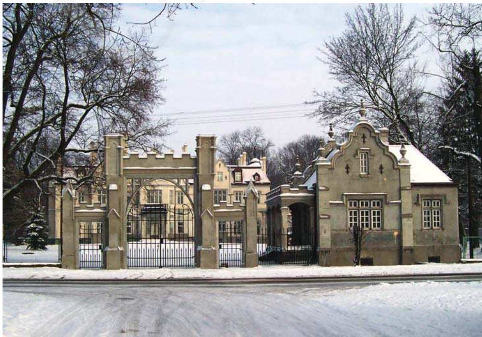
Il. 2. Pałac w Jabłoniu, brama wjazdowa i kordegarda, w głębi pałac. Fot. A. Cebulak, luty 2005.