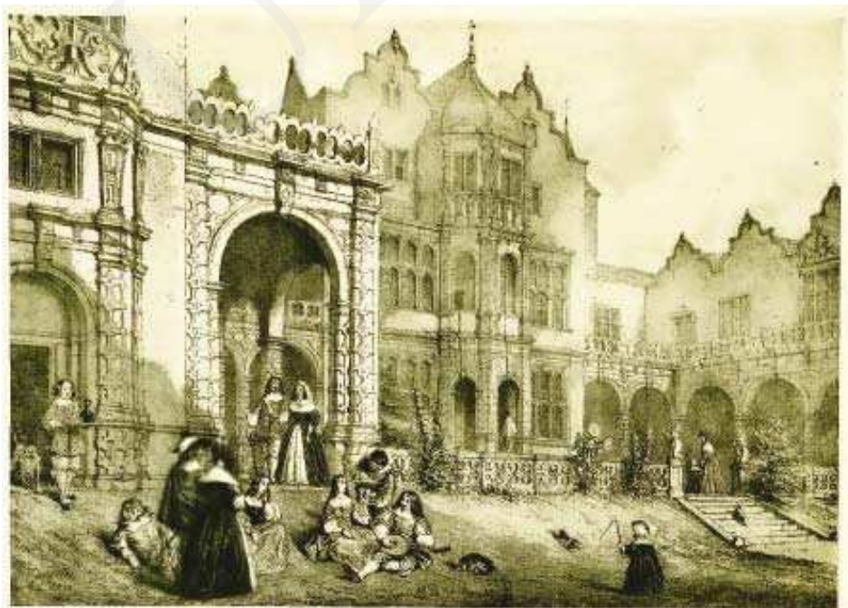
Il. 6. Holland House (Kensington). Repr. z: J. Nash, The Mansions of England in the Olden Time , New York 1912, ryc. 13.