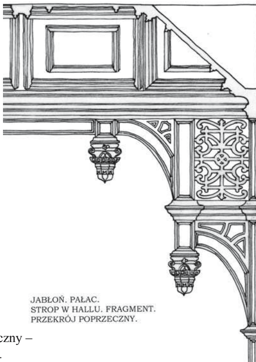
JABŁOŃ. PAŁAC. STROP W HALLU. FRAGMENT. PRZEKRÓJ POPRZECZNY.