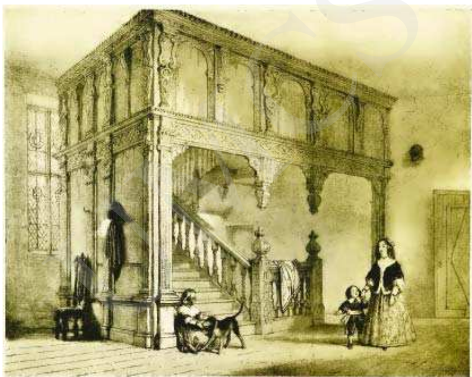
Il. 14. Wakehurst (Sussex). Repr. z: J. Nash, The Mansions of England in the Olden Time , New York 1912, ryc. 98.