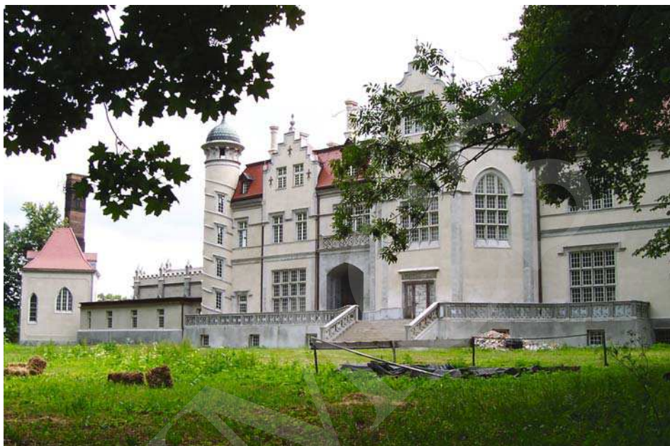
Il. 5. Pałac w Jabłoni, elewacja ogrodowa. Fot. A. Cebulak, lipiec 2006.