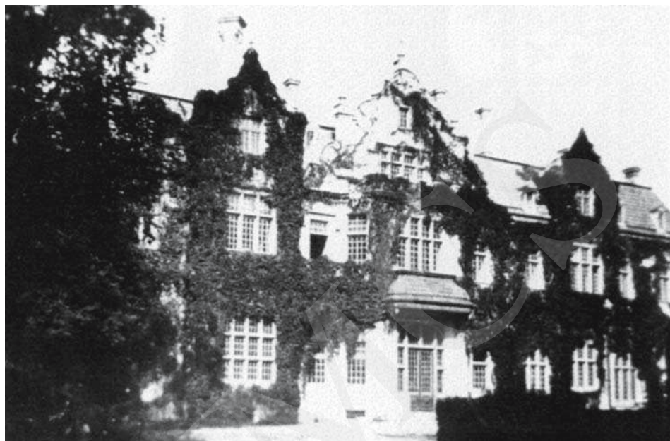
Il. 3. Pałac w Jabloniu, elewacja ogrodowa. 1935.