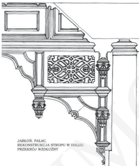
JABŁOŃ. PAŁAC. REKONSTRUKCJA STROPU W HALLU. PRZEKRÓJ WZDŁUŻNY