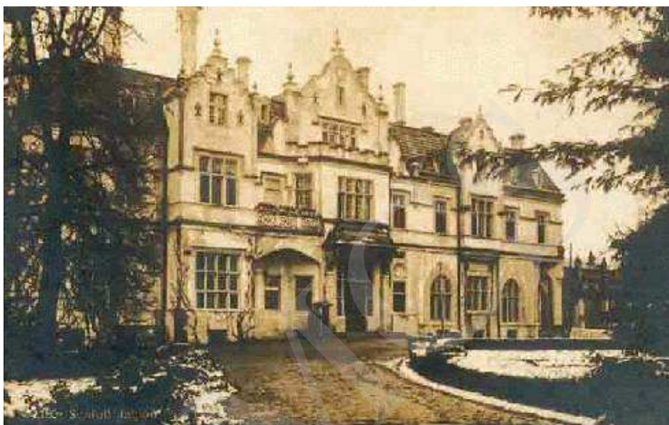
Il. 1. Pałac w Jabłoni, najstarszy znany widok z austriackiej widokówki z 1915 roku.