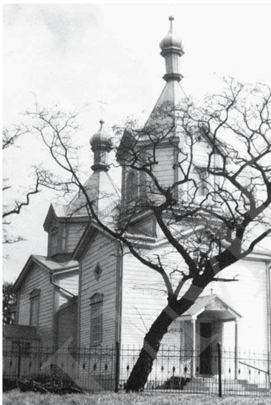
Il. 2. Michale – cerkiew, fot. M. Коц. Repр. z: Л. Бабич, В. Свистун, Храми Волині , Луцьк 2004, s. 36.