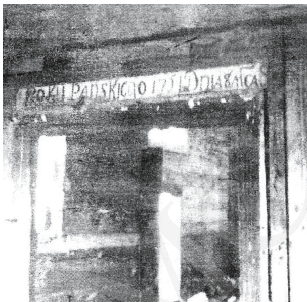
Il. 4. Michale – inskrypcja na nadprożu. Repr. z: O. Хведів, На кручі Бугу (Свято-Введнська церква села Михале). Історико-краєзнавчий нарис , Луцьк 2002, s. 11.