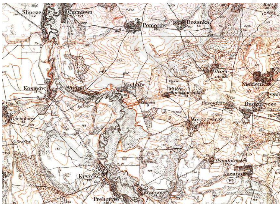
Il. 1. Michale i okolice, fragment mapy Karte des westlichen Russlands , 1915 r., 1 : 100 000, Gruppe III, 0/38, 0/39.