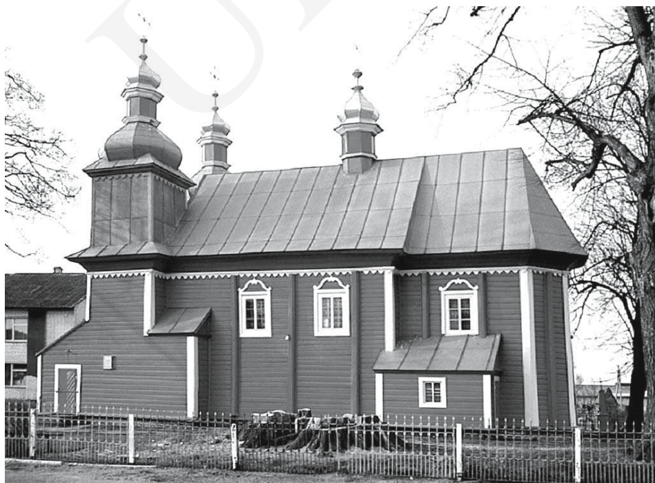
Il. 5. Olble Ruskie na Wołniu (obecnie: Грудки) – unicka cerkiew dwuwieżowa z 1771 roku. Fot. G. Rąkowski 2003.