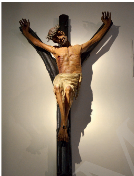
Ilustracja 9. Krucyfiks z kościoła św. Ignacego w Jihlavie.