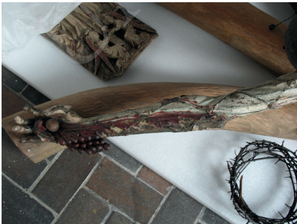
Ilustracja 2. Krucyfiks z kościoła Bożego Ciała we Wrocławiu, Ekspozycja Galerii Sztuki Średniowiecznej w Muzeum Narodowym w Warszawie.