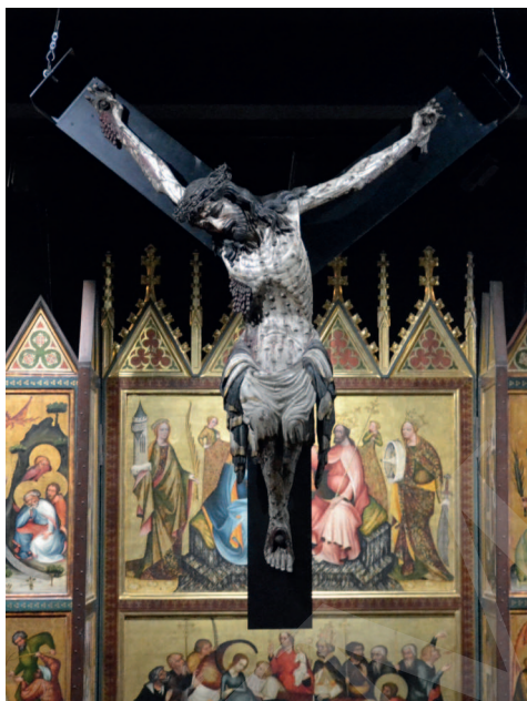
Ilustracja 1. Krucyfiks z kościoła Bożego Ciała we Wrocławiu, Ekspozycja Galerii Sztuki Średniowiecznej w Muzeum Narodowym w Warszawie.