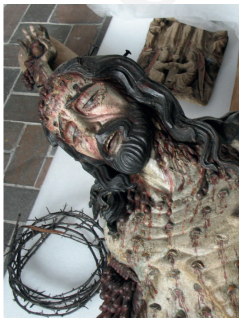
Ilustracja 4. Krucyfiks z kościoła Bożego Ciała we Wrocławiu, Ekspozycja Galerii Sztuki Średniowiecznej w Muzeum Narodowym w Warszawie.