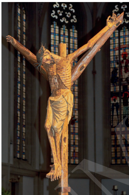
Ilustracja 17. Krucyfiks z kościoła św. Jerzego w Bocholt.