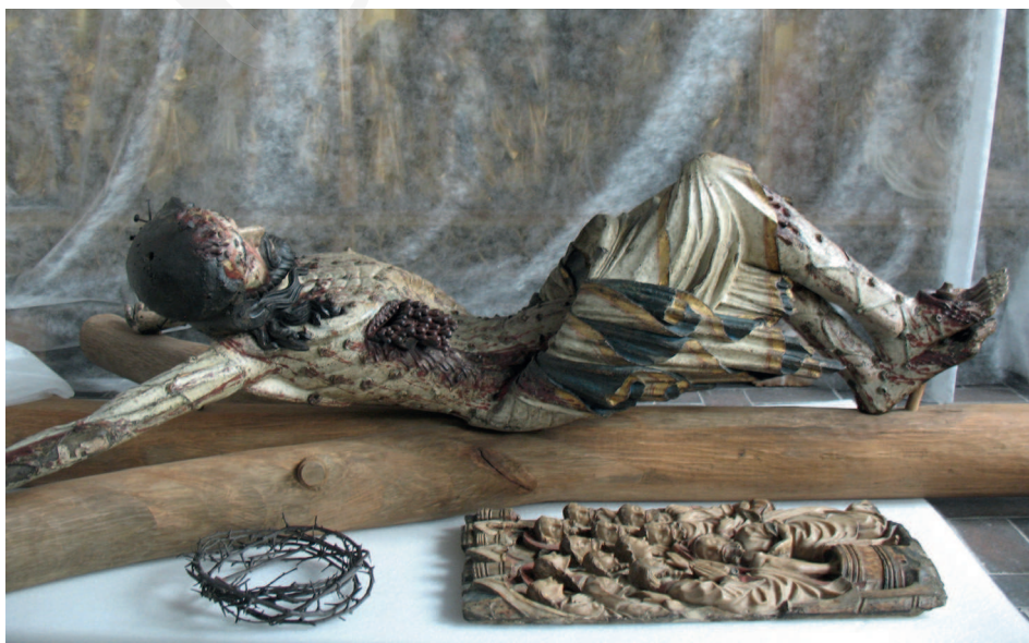
Ilustracja 6. Krucyfiks z kościoła Bożego Ciała we Wrocławiu, Ekspozycja Galerii Sztuki Średniowiecznej w Muzeum Narodowym w Warszawie.