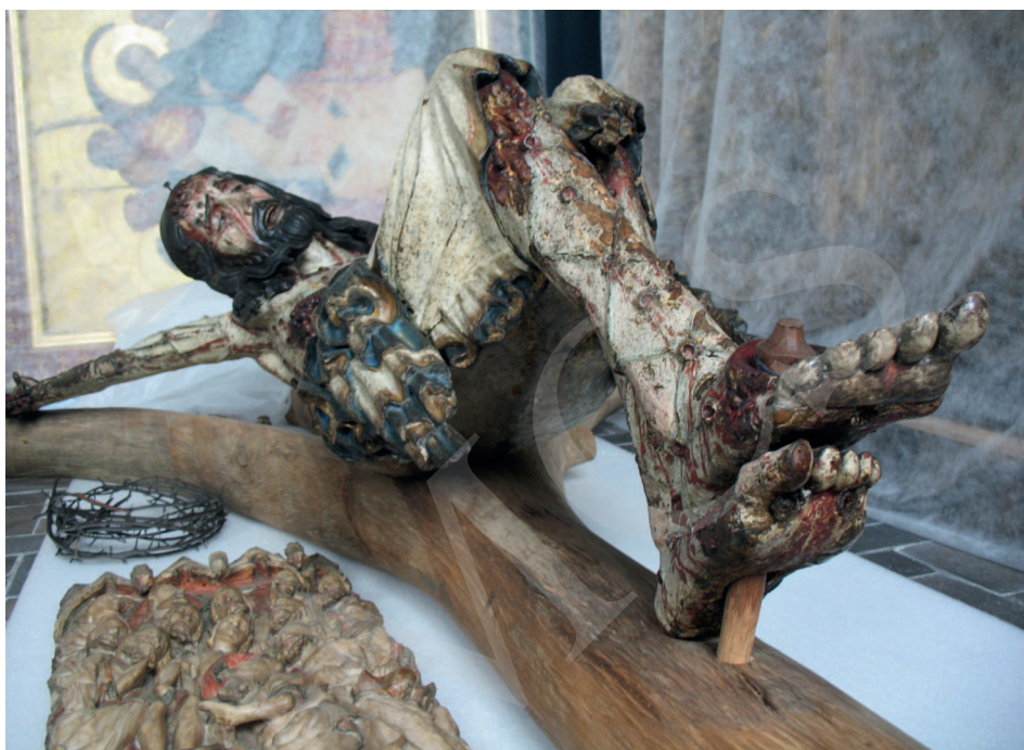
Ilustracja 5. Krucyfiks z kościoła Bożego Ciała we Wrocławiu, Ekspozycja Galerii Sztuki Średniowiecznej w Muzeum Narodowym w Warszawie.