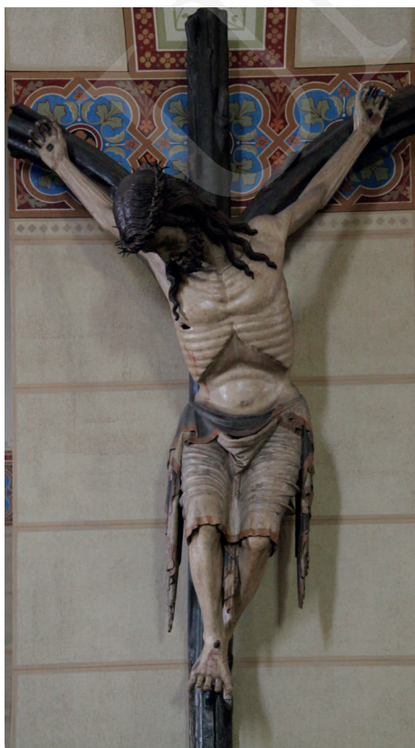
Ilustracja 10. Krucyfiks z kościoła Dominikanów w Friesach.