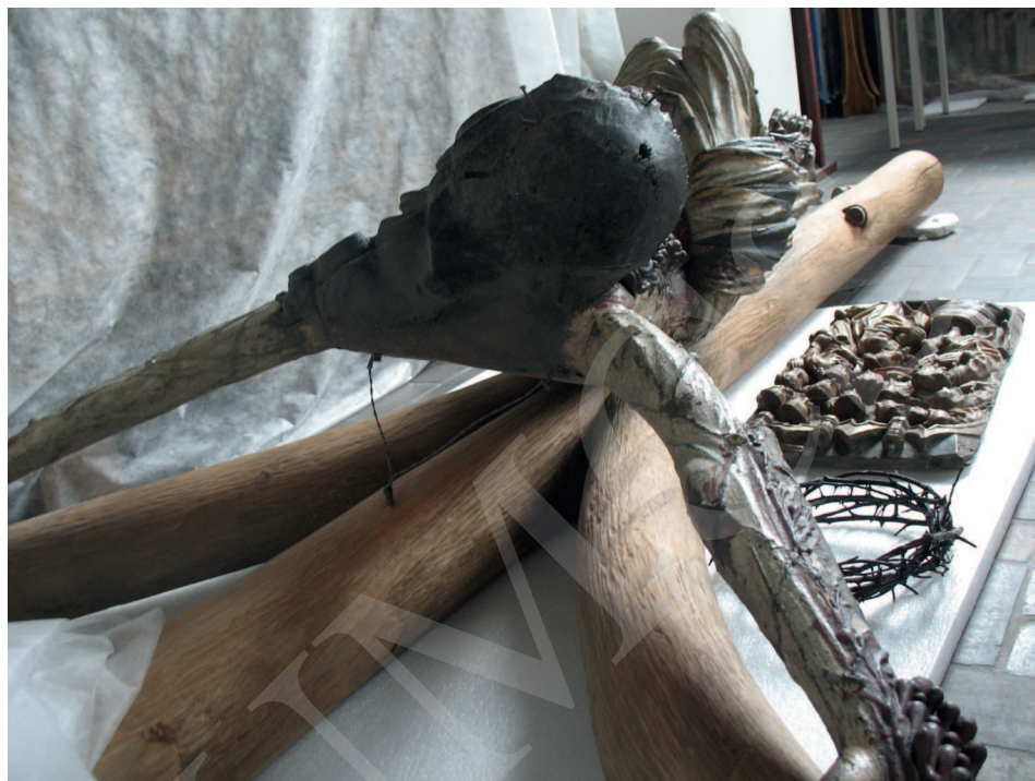
Ilustracja 3. Krucyfiks z kościoła Bożego Ciała we Wrocławiu, Ekspozycja Galerii Sztuki Średniowiecznej w Muzeum Narodowym w Warszawie.