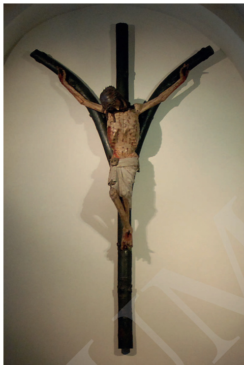
Ilustracja 11. Krucyfiks z kościoła Najświętszej Marii Panny na Kapitulu w Kolonii.