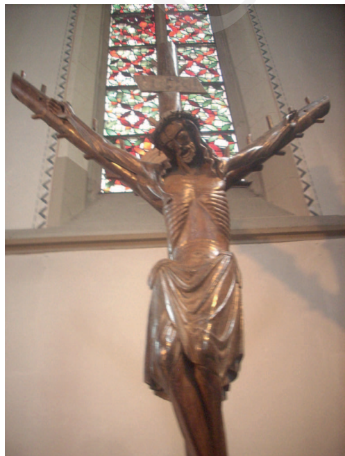
Ilustracja 12. Krucyfiks z kościoła św. Sykstusa w Haltern.