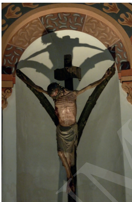
Ilustracja 13. Krucyfiks z kościoła Najświętszej Marii Panny w Andernach.