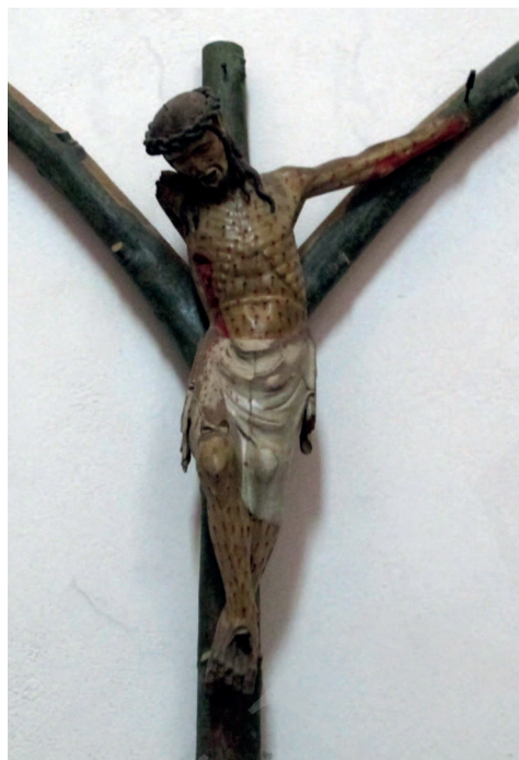
Ilustracja 15. Krucyfiks z kościoła św. Dominika w Orvieto.