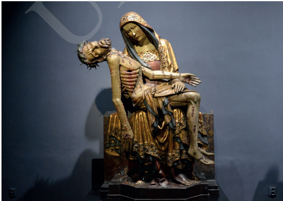
Ilustracja 18. Pieta z Lubiąży, Ekspozycja Galerii Sztuki Średniowiecznej w Muzeum Narodowym w Warszawie.