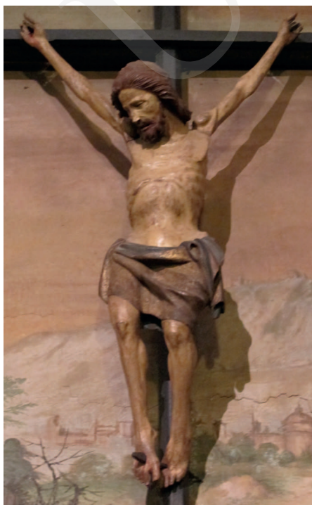
Ilustracja 14. Krucyfiks z kościoła św. Andrzeja w Pistoii.