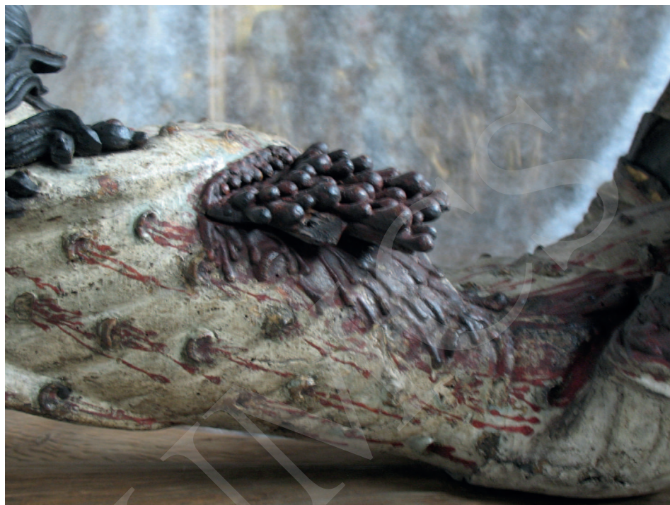
Ilustracja 7. Krucyfiks z kościoła Bożego Ciała we Wrocławiu, Ekspozycja Galerii Sztuki Średniowiecznej w Muzeum Narodowym w Warszawie.