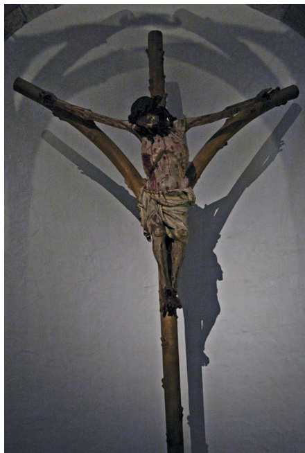
Ilustracja 8. Krucyfiks z kościoła św. Jerzego w Kolonii.