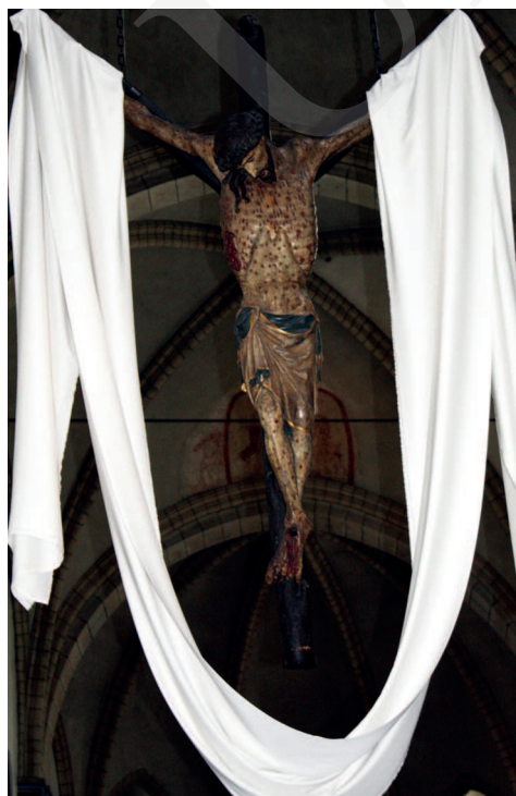
Ilustracja 16. Krucyfiks z kościoła św. Seweryna w Kolonii.