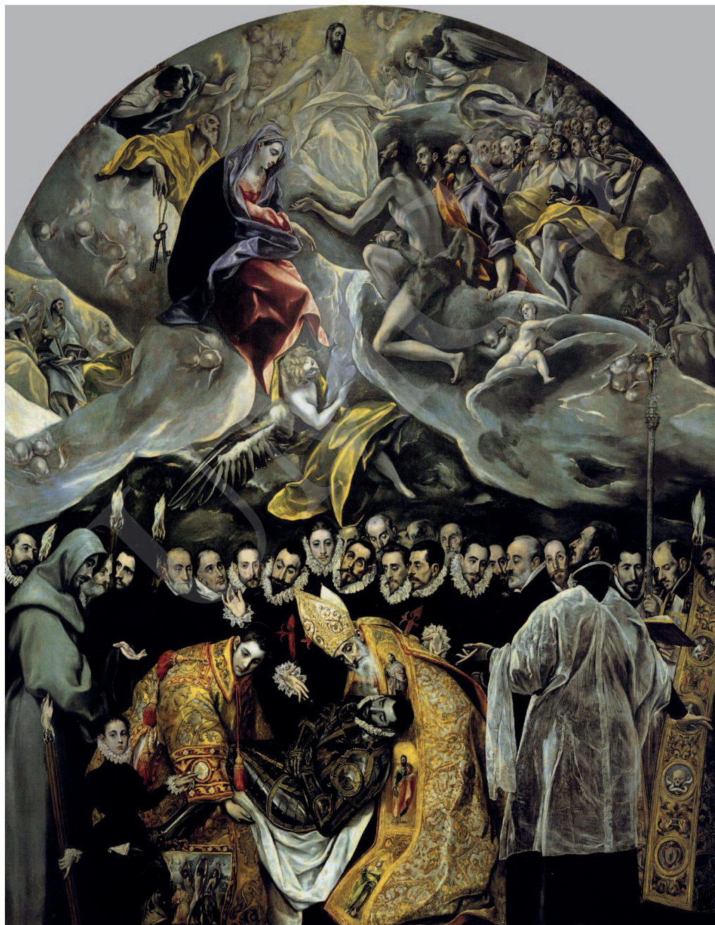
Ilustr. 2. El Greco, Pogrzeb Hrabiego Orgaza, ok. 1586-1588