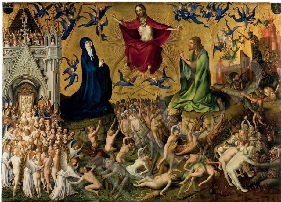
Ilustr. 1. Stefan Lochner, Sąd Ostateczny, ok. 1435

Patrząc wstecz, dostrzegamy, że każda epoka wytwarzała styl artystyczny najlepiej odbijający ówczesną wrażliwość, który – będąc stylem współczesnym – był także kontynuacją sztuki dawniejszej. Sztuka tradycyjna wskazywała nowemu pokoleniu, co ma robić. Te aspekty, które w sztuce przeszłości nie były podkreślone czy należycie wykorzystane, stawały się inspiracją dla następnego pokolenia. Przykłady nasuwają się same, np. koncepcje teologiczne w Sądzie Ostatecznym Stefana Lochnera z Katedry w Kolonii, gdzie ludzie zmartwychwstają prosto ze swoich ziemskich grobów, a z drugiej strony Pogrzeb hrabiego Orgaza pędzła El Greco, gdzie dusza niedawno zmarłego Don Gonzalo Ruiza z Toledo pojawia się w ramionach anioła w postaci delikatnie zarysowującego się „obłoku”.