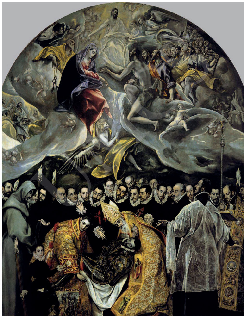
Ilustr. 2. El Greco, Pogrzeb Hrabiego Orgaza, ok. 1586-1588