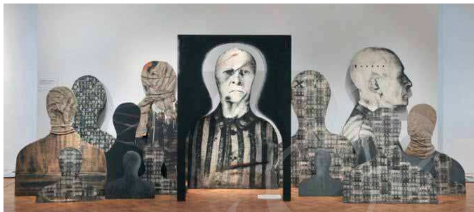
Ilustracja 4. J. Szajna, Reminiscence , źródło: https://muzeumslaskie.pl/pl/kalendarium/reminiscence-jozefa-szajny-panel-dyskusyjny [data dostępu: 25.10.2018].