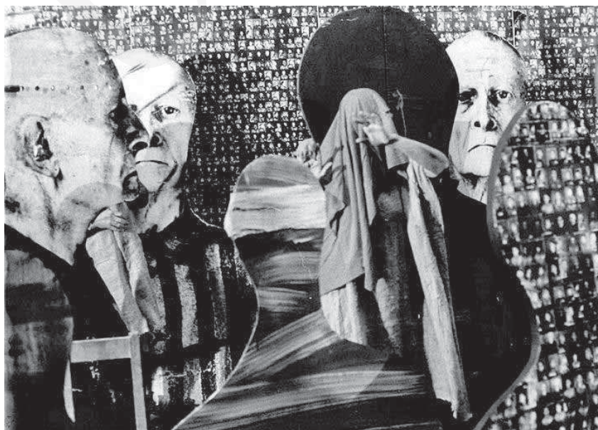
Ilustracja 3. J. Szajna, Sylwety i cienie