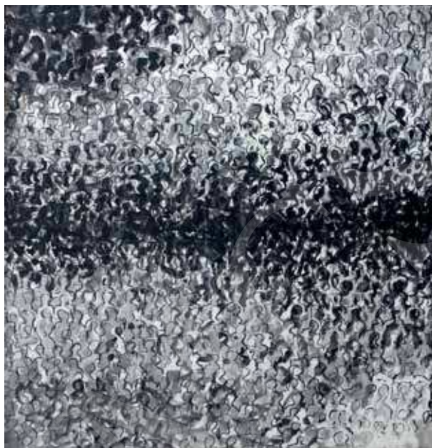
Ilustracja 2. J. Szajna, Mrowisko , źródło: https://www.artsper.com/en/contemporary-artworks/drawing/48589/from-the-series-mrowisko-ant-colony [data dostępu: 21.08.2018].