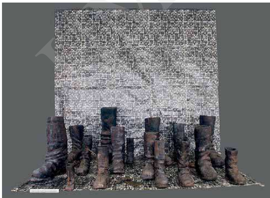
Ilustracja 5. J. Szajna, Drang nach Osten – Drang nach Westen , źródło: http://dmochochowskigallery.net/galeria_zoom.php?artist=4&picture=3251 [data dostępu: 30.08.2018].