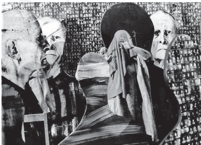
Ilustracja 3. J. Szajna, Sylwety i cienie