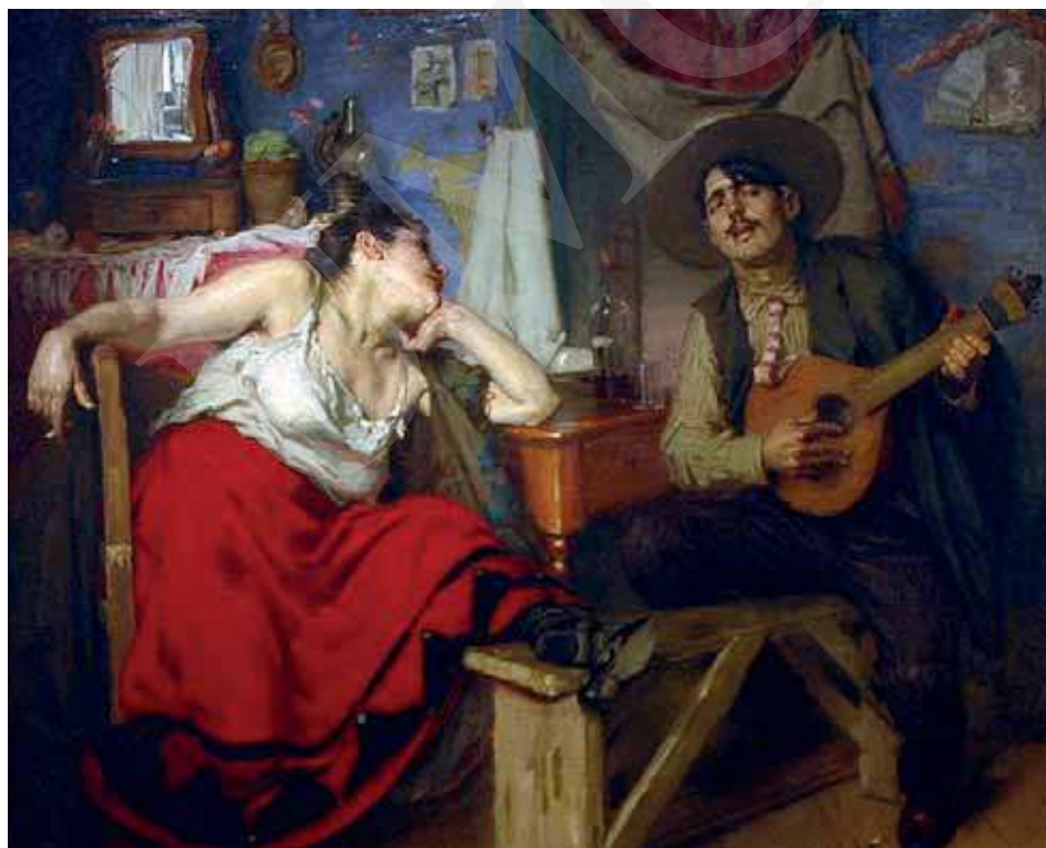
Ilustracja 1. Jose Malhoa, Fado , 1910, olej na płótnie, 150cm×183cm, Museu da Cidade, Lizbona; cyt. [za:] Vieira Nery, op. cit. , s. 87.

Warto w tym miejscu odnotować reakcje sztuk pięknych. Wokalno-instrumentalna interpretacja fado stała się na początku XX wieku natchnieniem dla portugalskiego malarza José Malhoa, który jedną ze swoich prac opatrzył tytułem Fado .