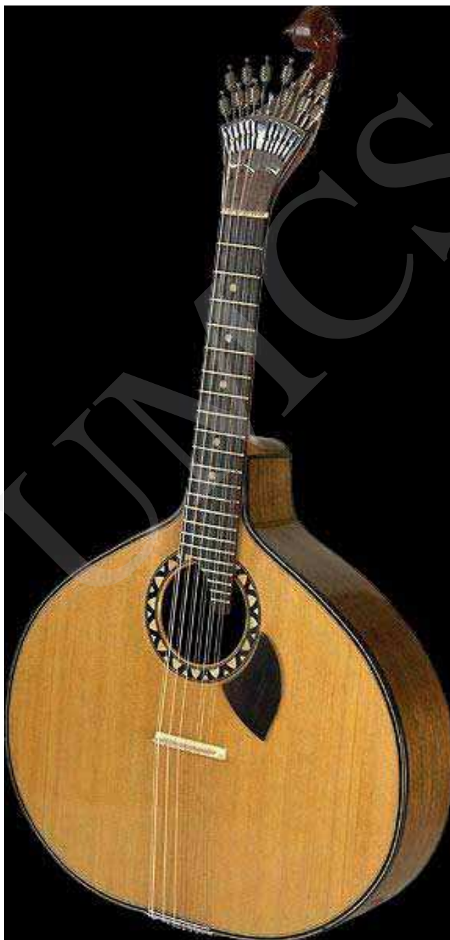
Ilustracja 2. Gitara portugalska, cyt. [za:] www.pinterest.co.uk/yvanroyen/fado [data dostępu: 02.01.2018].