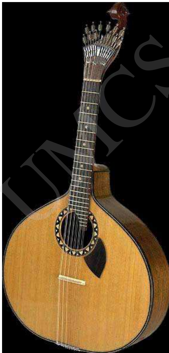
Ilustracja 2. Gitara portugalska