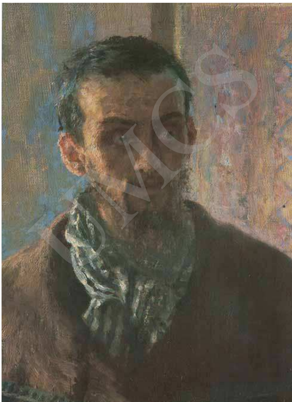
Ilustracja 2. Ilja Riepin, Nie żdali , fragment.