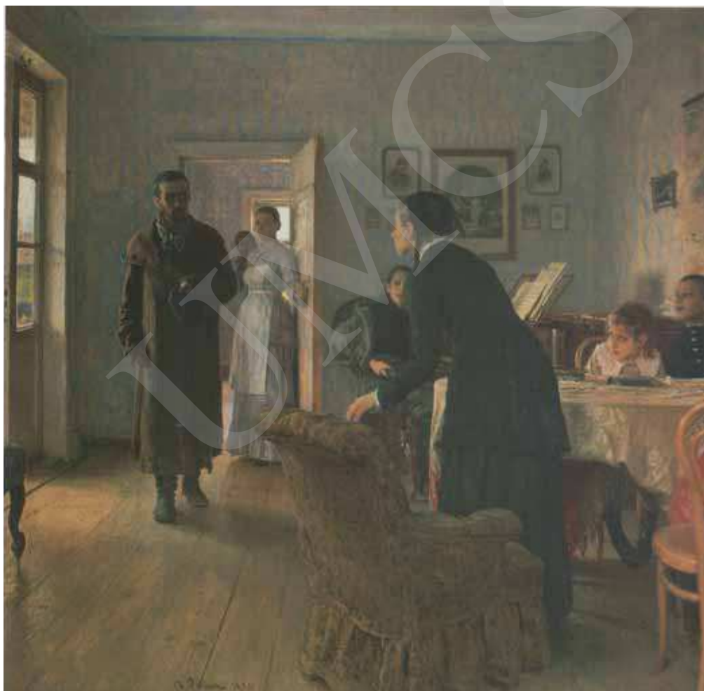
Ilustracja 1. Ilja Riepina, Nie zdali , 1884-1888, olej na płótnie, 160,5cm x 167,5cm.