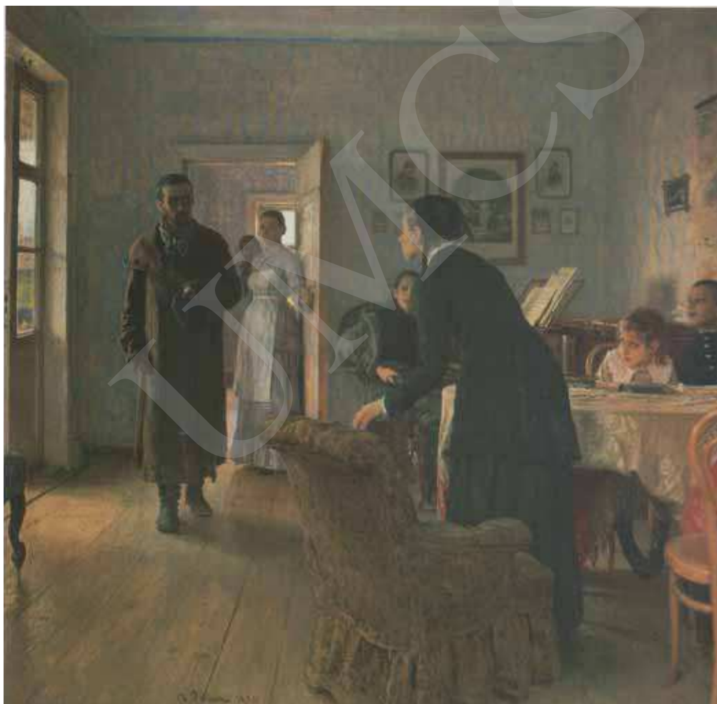
Ilustracja 1. Ilja Riepina, Nie żdali , 1884-1888, olej na płótnie, 160,5cm x 167,5cm.