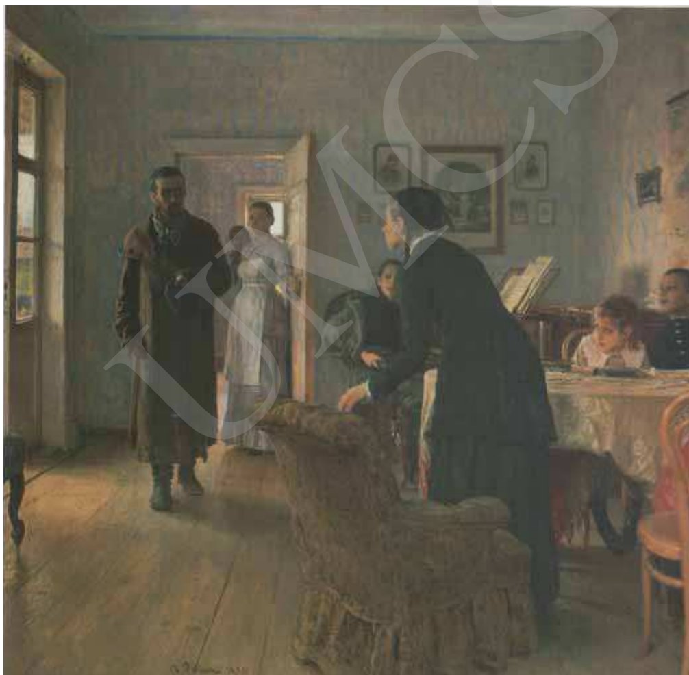
Ilustracja 1. Ilja Riepin, Nie żdali , 1884-1888, olej na płótnie, 160,5cm x 167,5cm.