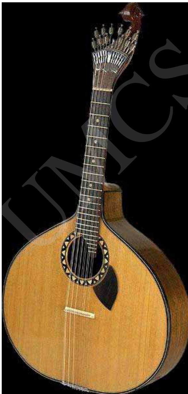
Ilustracja 2. Gitara portugalska