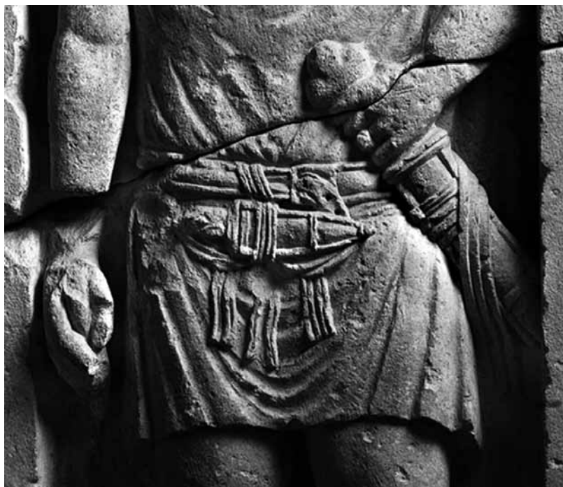
Ryc. 2. Detal płaskorzeźby centuriona Minuciusa Lorariususa (ze zbiorów Museo Archeologico, Padwa; źródło: Europeana free commons)

gi na rozmiary wolnej przestrzeni, nie mógł zawierać nazwy tribus , do której centurion został przyporządkowany 22 , co na pierwszy rzut oka budzi poważne wątpliwości co do posiadania przez niego obywatelstwa rzymskiego. Lawrence Keppie zwrócił jednak uwagę, że nie wszystkie inskrypcje z okresu augustowskiego zawierają tego typu informacje 23 . Na serdecznym palcu lewej dłoni Lorariususa, która opiera się na głowicy miecza, można natomiast dostrzec pierścień (ryc. 2) będący oznaką przynależności do stanu ekwickiego ( ordo equester ). Ta zaś była możliwa wyłącznie w przypadku posiadania obywatelstwa rzymskiego. Po zakończeniu służby wojskowej Lorariusus musiał je więc otrzymać, a zgromadzony majątek pozwolił mu na wejście do kategorii ekwitów. Siłą rzeczy musiał również być członkiem lokalnej elity. O takich przypadkach w odniesieniu do późnorepublikańskich centurionów pisał Horacy (Quintus Horatius