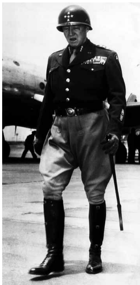
Ryc. 4. Fotografia przedstawiająca amerykańskiego gen. George'a S. Pattona trzymającego trzcinkę (szpicrutę?) w sposób podobny do Lorariusza (źródło: Wikipedia free commons)

riusa jest typowy dla sztywnego przedmiotu, co potwierdza m.in. jeden z regulaminowych sposobów trzymania tzw. trzcinki przez oficerów XVIII- i XIX-wiecznych armii europejskich, a obecnie sił zbrojnych państw wchodzących w skład Commonwealthu oraz armii amerykańskiej (ryc. 3, 4). Można go także zobaczyć na pochodzących z I w. po Chr. płaskorzeźbach nagrobnych Marcusa Caeliusa (ryc. 5) i Marcusa Favoniusa Facilisa. Po czwarte: jeśli dokładnie przyjrzeć się dłoni Lorariusza, to górna część przedmiotu znajdująca się powyżej jej krawędzi ma przekrój owalny (ryc. 2), niezwykle trudny do osiągnięcia w przypadku pasa skóry, natomiast typowy dla drewnianej różgi. Po piąte: fakt, że każdy przedstawiciel rodu Minucii Rufi nosił cognomen Rufus, nie sprawiał automatycznie, iż miał on rude włosy, tak samo jak gentilicum Porcius nie świadczyło, że każdy jego posiadacz zajmował się hodowlą trzody chlewnej. Etymologicznie cognomen Lorarius może najwyżej sugerować, że rodzina centuriona zajmowała się niegdyś wytwarzaniem skórzanych przedmiotów 30 . Po szóste wreszcie: u schyłku republiki centurionowie otrzymali uprawnienia do wykonywania wobec żołnierzy kar cielesnych przy pomocy różgi, co wynikało z chęci obejścia norm zawartych w leges Porciae 31 . Byłoby dziwne, gdyby Lorarius zamiast symbolu sprawowanej funkcji, dobrze znanego z wczesnocesarskich przedstawień, dzierżył pasy skóry. Wszystko to czyni interpretację D'Amato niemożliwą do przyjęcia.