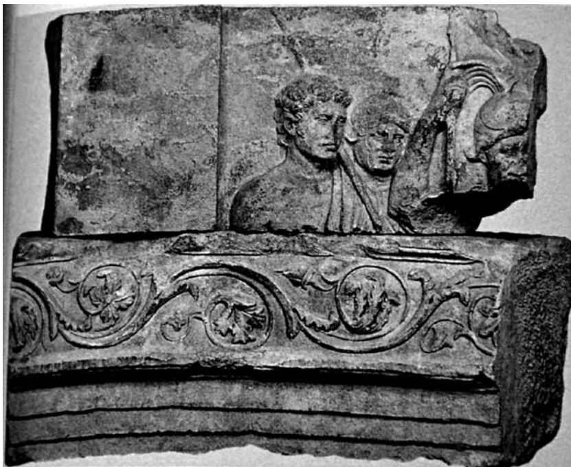
Ryc. 7. Fragment płaskorzeźby nagrobnej Publiusa Ventidiusa Bassusa (ze zbiorów Palazzo dei Conservatori, Rzym)

bardziej prawdopodobne – włócznią/oszczepem. Crista transversa sugeruje, że mamy do czynienia z dowódcą. Podłużny przedmiot, o ile nie jest różgą, nie stanowi żadnej wskazówki, ponieważ postać przedstawiona na tzw. ołtarzu Domitiusa Ahenobarbusa także dzierży włócznię, a ponad wszelką wątpliwość nie jest centurionem. Na płaskorzeźbie z 35 r. żołnierz nie tylko wyróżnia jednak crista transversa , ale także brak elementów ozdobnych, będących regularnym motywem występującym w przypadku oficerów 64 . Nie ma przy tym znaczenia, czy chodziło stricte o centuriona, czy jest to po prostu postać ukazana przy wykorzystaniu atrybutów typowych dla centuriona – jej obecność na reliefie raczej nie jest przypadkowa, co każe zastanowić się nad powodem, dla którego ją wykorzystano.