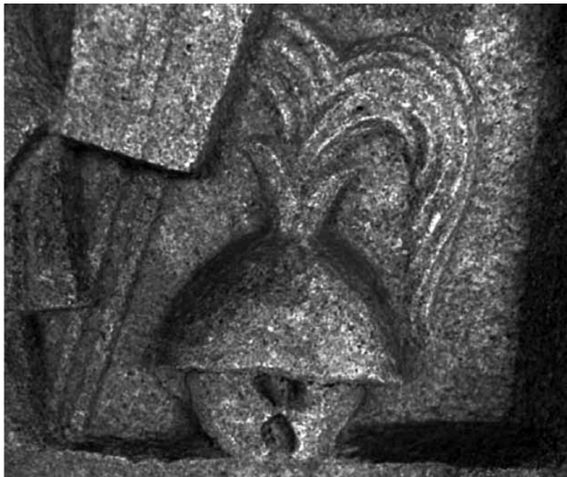
Ryc. 11. Fragment monumentu z Akwilei (ze zbiorów Museo Archeologico Nazionale, Aquileia; źródło: R. D'Amato, Roman Centurions 753–31 BC. The Kingdom and the Age of Consuls , Oxford 2011, s. 15)

być poprzeczny, zaś wyeksponowanie centuriona na pierwszym planie wskazuje na przypisywanie tej kategorii żołnierzy wyjątkowej dzielności i waleczności.