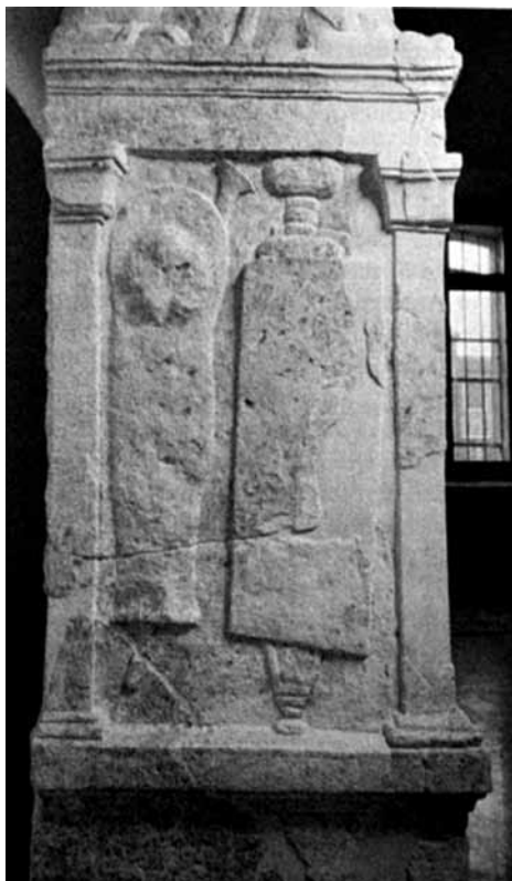
Ryc. 6. Płaskorzeźba nagrobna centuriona Luciusa Blattiusa Vetusa (ze zbiorów Museo Nazionale, Atestino)

W przekazach źródłowych można odnaleźć wzmianki nie tylko o byłych centurionach-ekwitach, ale również o przedstawicielach stanu ekwickiego, którzy wstępowali do armii, obejmując od razu stanowiska centurionów 44 . Nicolet zwrócił uwagę, że większość późnorepublikańskich ekwitów wywodziła się z rodów italskich niebiorących czynnego udziału w życiu politycznym Rzymu i niewykazujących przywiązania do tradycyjnego wizerunku swojej grupy społecznej 45 . Wzrost znaczenia centurionów, objawiający się m.in. wzrostem przyznawanych im poborów oraz rozszerzeniem zakresu kompetencji 46 , przyczynił się zatem do powstania przeświadczenia o możliwości uzyskania szybkiego awansu społecznego dzięki służbie w armii w stopniu centuriona. Lorarius jest tego dobrym przykładem, choć znane są nawet przypadki, kiedy dzięki protekcji swoich wodzów zdemobilizowani centurionowie stawali się senatorami 47 .