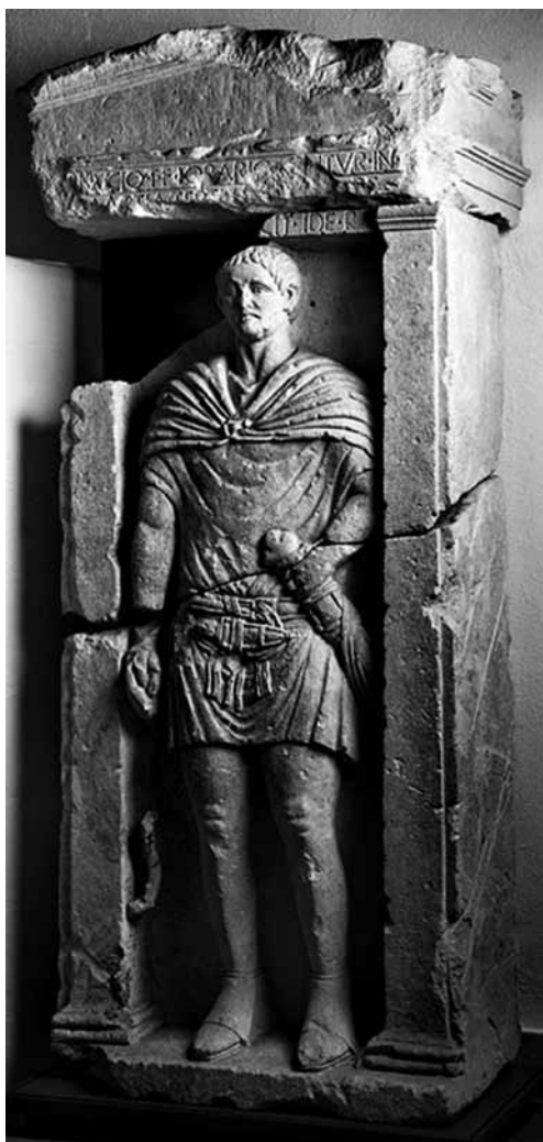
Ryc. 1. Płaskorzeźba nagrobna centuriona Minuciusa Lorariusza (ze zbiorów Museo Archeologico, Padwa; źródło: Europeana free commons)

dysponujemy. Ułatwiają to pewne charakterystyczne szczegóły pojawiające się na płaskorzeźbach, którym nie należy jednak nadawać charakteru absolutnego już choćby z tego względu, że sporządzający je rzemieślnicy nie musieli mieć dokładnej wiedzy z zakresu militariów, a fundator niekoniecznie musiał przywiązywać wagę do detali.