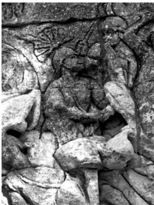
Ryc. 8. Fragment łuku z Glanum (St. Remy)

Niewykluczone, że z centurionem mamy także do czynienia w przypadku łuku komemoratywnego z Glanum (współ. St. Remy; ryc. 8). Perspektywa przedstawiona na płaskorzeźbie jest jednak zbyt silnie zaburzona, aby można było mieć pewność, czy pióropusz widniejący na hełmie został umocowany wzdłuż, czy w poprzek dzwonu. Mimo to wydaje się, że jego posiadaczem jest centurion, a to na podstawie wyraźnie widocznego pendentu biegnącego od prawego ramienia do lewego boku. Wiadomo, że w taki sposób miecze nosili właśnie centurionowie 78 albo – wnioskując na podstawie opisywanego monumentu – żołnierze służący w konnicy. Domniemany centurion jest jednak piechurzem i upatrywanie w nim spieszonoego jeźdźca, który być może przed chwilą stracił