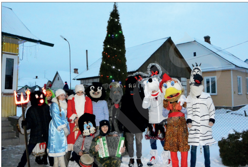
Адна з груп „Конікаў” у Давыд-Гарадку 13 студзеня 2017 г.

s. 321–322). Аўтарка гэтага тэксту апісала „Конікаў” пасля выезду ў Давыд-Гарадок у 2017 г. (Leshkevich, 2022, s. 33–34) і прасачыла трансфармацыю абраду, параўноўваючы яго з „хаджэннем з казой” на Куявіі (Leshkevich 2023b).