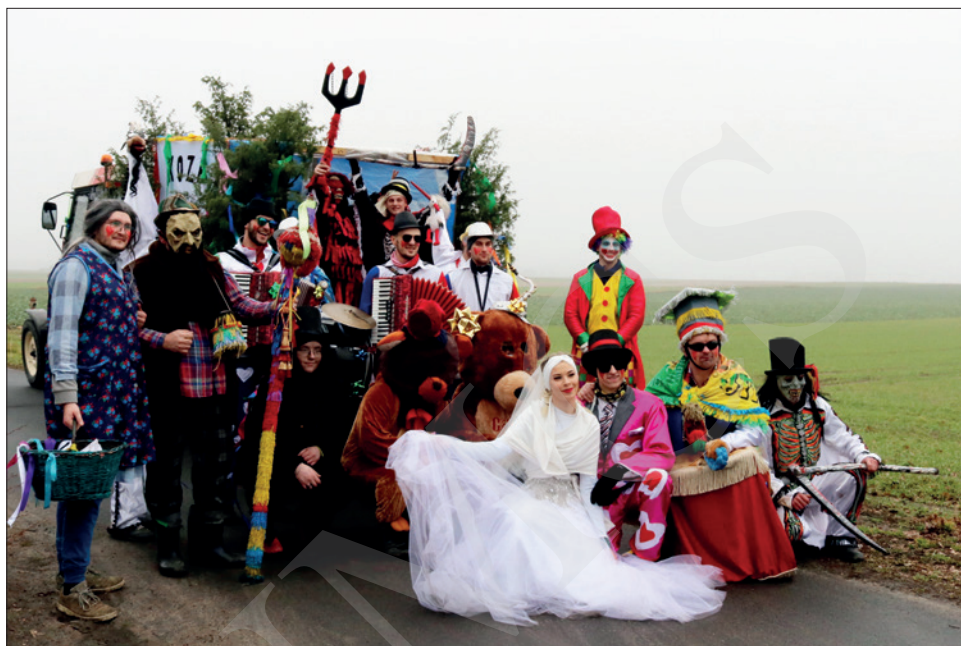
Група пераапанутых Koza Florianowo 10 лютага 2024 г.

Хаця „хаджэнне з казой” на Куяві адбываецца на Запусты, а шчадраванне „Конікі” ў Давыд-Гарадку – напярэдадні Старога Новага года, гэтыя звычэй тыпалагічна блізкія, бо іх аснову складае абыход двароў пераапанутымі персанажамі як частка абраду пераходу у тэрміналогіі Арнольда Ван Генэпа (1909), і таму параўнанне іх асвятлення ў медыя абгрунтаванае. У абодвух выпадках абыходы праходзяць спантанна, без умяшальніцтва работнікаў культуры, хаця праводзяцца і арганізаваныя „зверху” мерапрыемствы: у выпадку Куяві гэта гмінныя прагляды запустных гуртоў у Тапульцы, Ізбіцы Куяўскай і Любранныцы, а таксама шэсце ва Ёлацлаўку, а ў Давыд-Гарадку – канцэрт з дыскатэкай на Цэнтральнай плошчы і конкурс на лепшага „коніка”. У абедзвюх даследаваных мясцовасцях да традыцыйных персанажаў у гуртах пераапанутых дадаюцца новыя. Абодва элементы ўнесены ў нацыянальныя спісы НКС у 2020 г.