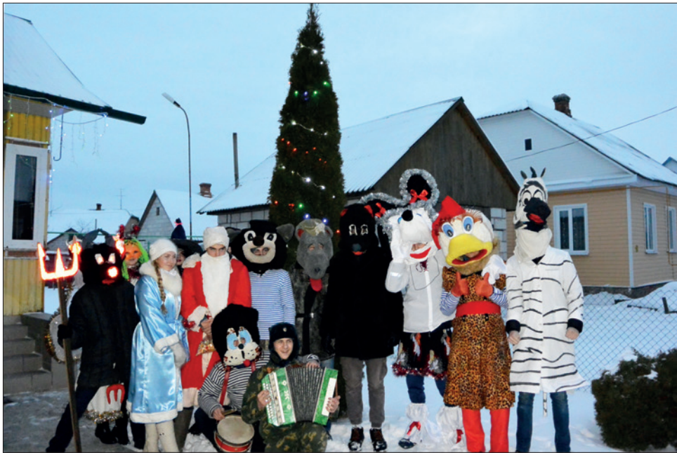
Адна з груп „Конікаў” у Давыд-Гарадку 13 студзеня 2017 г.

s. 321–322). Аўтарка гэтага тэксту апісала „Конікаў” пасля выезду ў Давыд-Гарадок у 2017 г. (Leshkevich, 2022, s. 33–34) і прасачыла трансфармацыю абраду, параўноўваючы яго з „хаджэннем з казой” на Куявіі (Leshkevich 2023b).