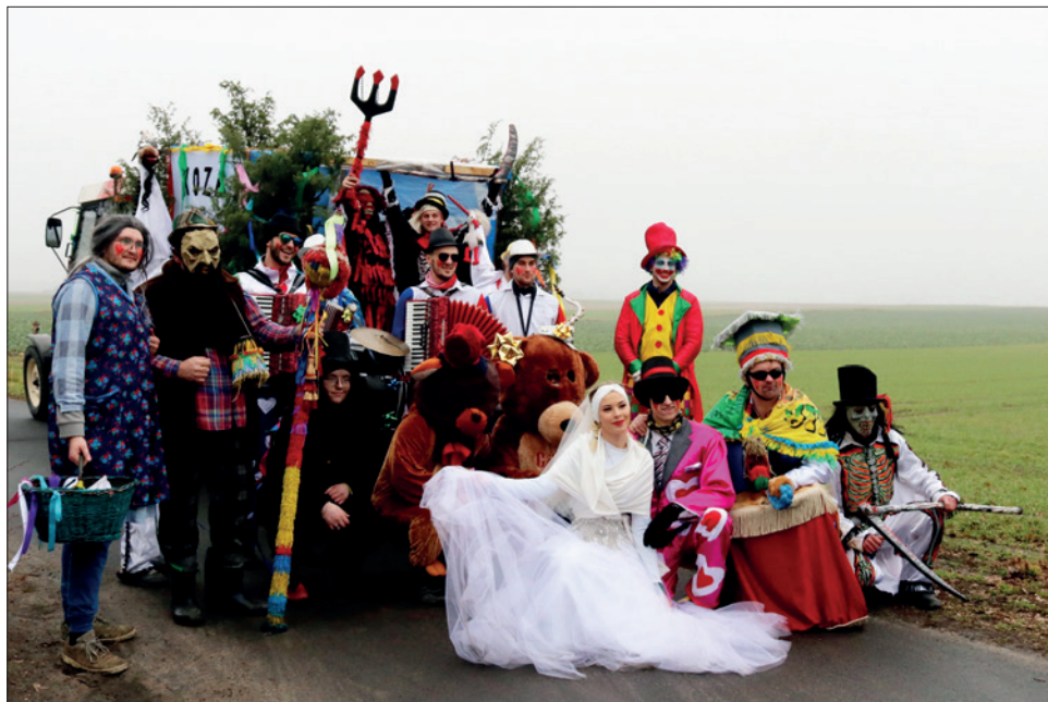
Група пераапанутых Koza Florianowo 10 лютага 2024 г.

Хаця „хаджэнне з казой” на Куяві адбываецца на Запусты, а шчадраванне „Конікі” ў Давыд-Гарадку – напярэдадні Старога Новага года, гэтыя звычэй тыпалагічна блізкія, бо іх аснову складае абыход двароў пераапанутымі персанажамі як частка абраду пераходу у тэрміналогіі Арнольда Ван Генэпа (1909), і таму параўнанне іх асвятлення ў медыя абгрунтаванае. У абодвух выпадках абыходы праходзяць спантанна, без умяшальніцтва работнікаў культуры, хаця праводзяцца і арганізаваныя „зверху” мерапрыемствы: у выпадку Куяві гэта гмінныя прагляды запусных гуртоў у Тапульцы, Ізбіцы Куяўскай і Любраньцы, а таксама шэсце ва Ёлацлаўку, а ў Давыд-Гарадку – канцэрт з дыскатэкай на Цэнтральнай плошчы і конкурс на лепшага „коніка”. У абедзвюх даследаваных мясцовасцях да традыцыйных персанажаў у гуртах пераапанутых дадаюцца новыя. Абодва элементы ўнесены ў нацыянальныя спісы НКС у 2020 г.