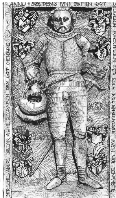
2. Nagrobek przed osobą Franza von Dyherrna, rys. autorstwa M. Kruszewskiej