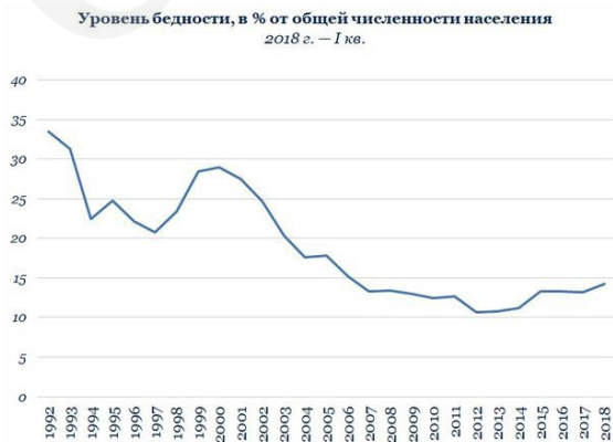
Таблица 1. Динамика уровня бедности в России (1992–2018 г.г.)