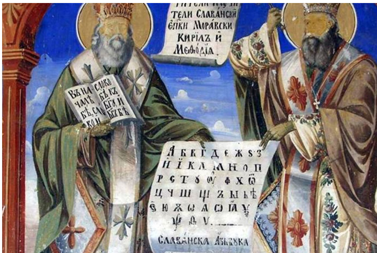
Foto 1. Fresk przedstawiający św. Metodego i Cyryla z zapisem fragmentu Ewangelii św. Jana.