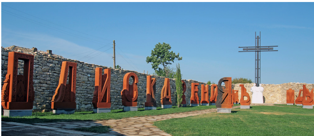
Foto 6: Pismo. Usytuowanie liter tworzy napis PLISKA. Autor: Ruben Nalbandjan.

Źródło: http://дворнакирилицата.bg/snimki/