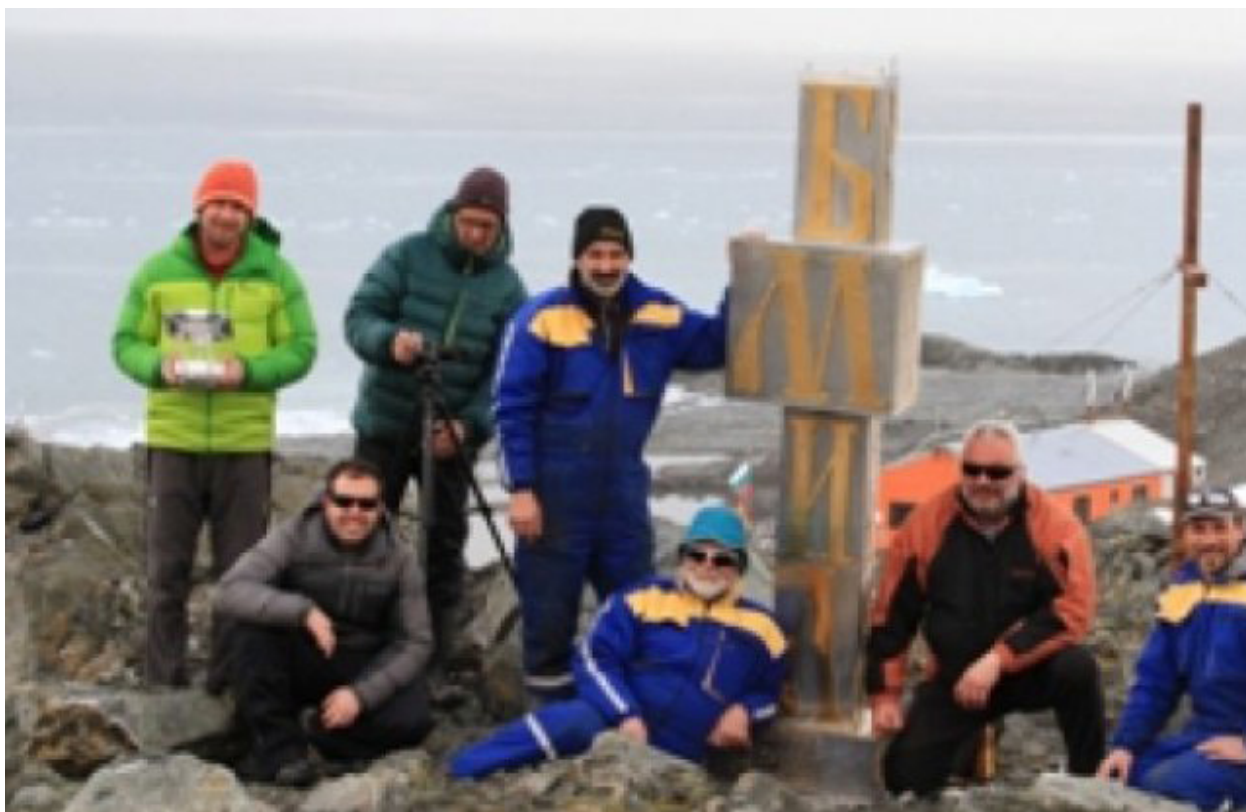
Foto 8: Pomnik cyrylicy na Antarktydzie. Autor: Mladen Jordanov Stanev.